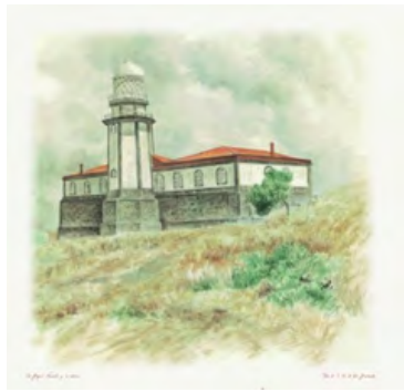
Ilustración: Bernardo Lara

En el año 2020, prácticamente el 76% de la superficie catastral del AIS estaba catalogada como superficie rústica y el restante 24% como superficie urbana, de la cual, prácticamente el 70% estaba construida quedando el otro 30% como solar sin edificar.