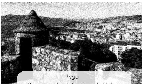
Vigo. PN de las Islas Atlánticas de Galicia

Un 46,5% de la superficie del territorio del Área de Influencia Socioeconómica lo ocupan zonas forestales, principalmente bosques de frondosas y bosques de coníferas a partes iguales, seguidos por landas y matorrales mesófilos. Las superficies artificiales, con un 27,2%, ocupan el segundo lugar en extensión del AIS, principalmente ocupado por tejido