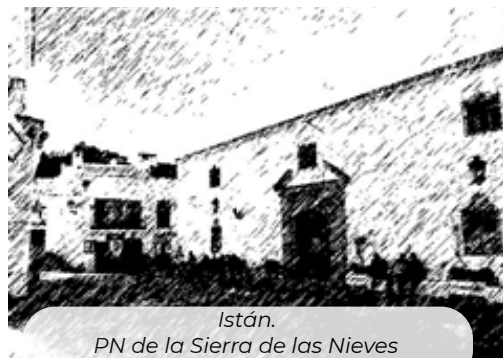
Istán. PN de la Sierra de las Nieves

En el año 2020, el 97,1% de la superficie catastral del AIS estaba catalogada como superficie rústica y el restante 2,9% como superficie urbana, de la cual, el 48,1% estaba construida quedando el otro 51,9% como solar sin edificar.