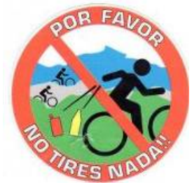
Pegatina repartida por el comité organizador a los participantes y público asistente

Todas estas medidas tuvieron una excepcional acogida por parte de los participantes, cuya actitud propició una mínima recogida de residuos por el equipo de limpieza: media bolsa de 25 l. de volumen en 200 km! y una disminución significativa de envases de plástico, de 8.000 previstos a menos de 1.000 envases.