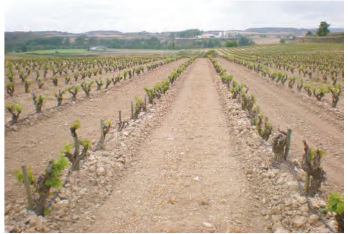
Parcela zona continental (Roda, RO)