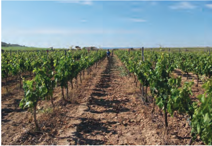
Parcela zona mediterránea (Aranjón, TRR)