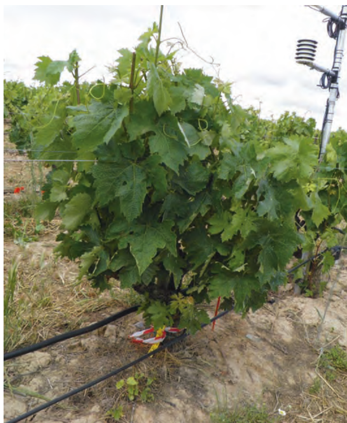
Cepa del tratamiento regado en Roda

En la zona Mediterránea ese aumento proviene de que existe un aumento de fertilidad (racimos por sarmiento), una mayor tasa de cuajado (bayas por racimo) y bayas con mayor peso