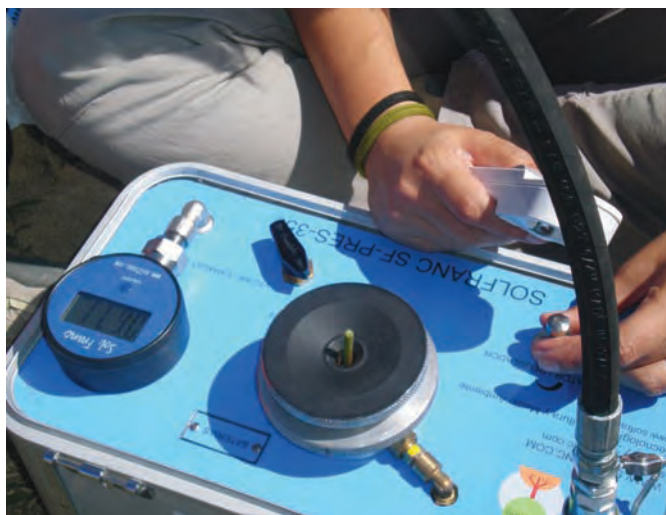
Medida de potencial hídrico foliar (Roda, RO).

En el año 2010 esta diferencia es menor debido a que las precipitaciones registradas son superiores, siendo el 2011 un año muy seco en el cual no se registraron precipitaciones en los meses de maduración en la zona Mediterránea y muy escasas en La Rioja Alta. Como ya se ha explicado anteriormente, este suceso también tuvo consecuencias en el rendimiento, sobre todo en el caso de la zona Mediterránea, dando lugar a modificaciones en la calidad del mosto. El aumento de las temperaturas medias y la escasa pluviometría durante la maduración en el año 2011 han sido determinantes en la acumulación de sólidos solubles en la baya, alcanzando la madurez en un periodo de tiempo inferior