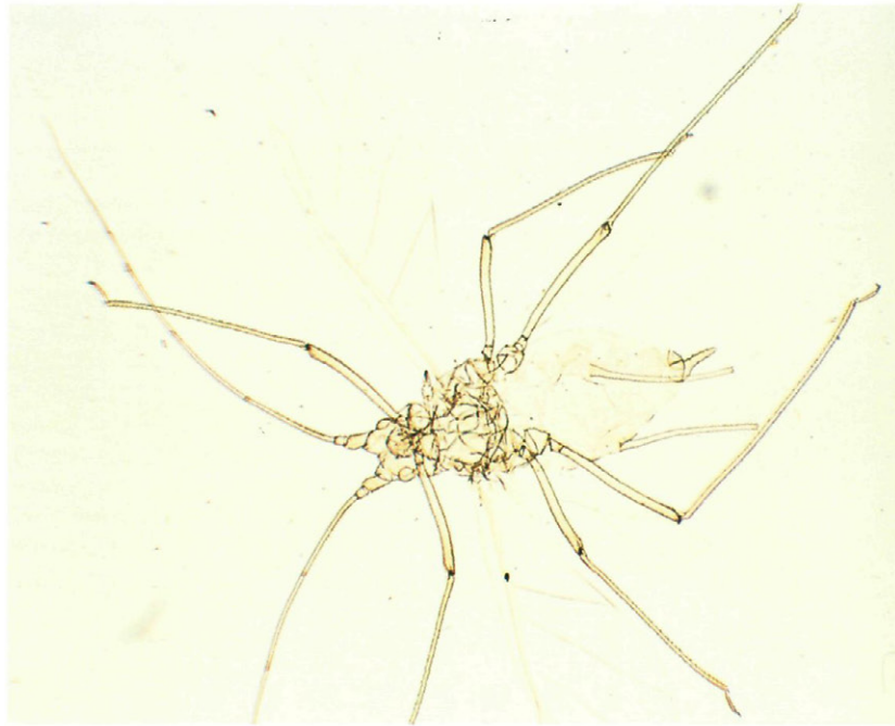
Fig. 1.— Acyrthosiphon (A.) gossypii Mordvilko, 1914 hembra vivípara alada.