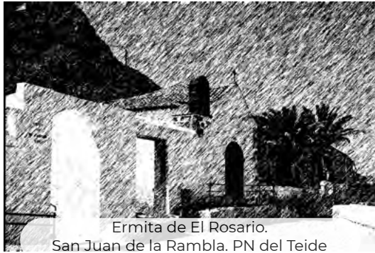
Ermita de El Rosario. San Juan de la Rambla. PN del Teide

Los datos del Servicio Público de Empleo referente a los contratos por sectores de producción, registrados durante los meses de marzo de los sucesivos años en los municipios pertenecientes al Área de Influencia Socioeconómica del Parque Nacional del Teide, señalan que alrededor de un 80% de los mismos corresponden al sector servicios, porcentaje similar