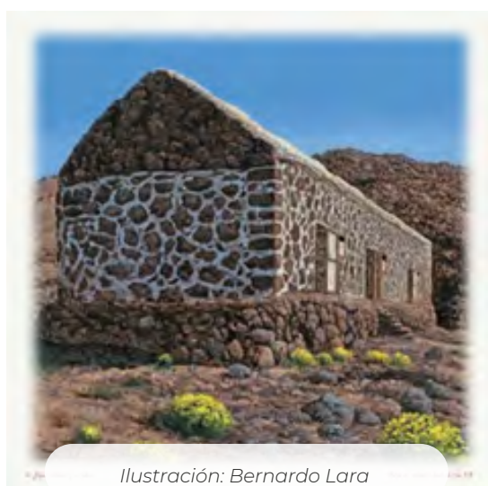
Ilustración: Bernardo Lara

En el último cuarto de siglo todos los municipios excepto Garachico presentan incrementos de población más o menos acusadas siendo Adeje (que casi triplica su población) y Granadilla de Abona (que casi la duplica) los que más habitantes aumentaron en este periodo. Globalmente, los municipios del AIS tienen una densidad de 221 personas/km 2 , ligeramente inferior de los datos de la provincia o de la comunidad autónoma.