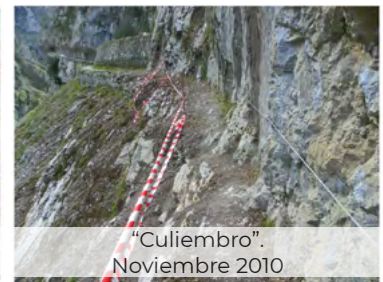
“Culiembro”. Noviembre 2010