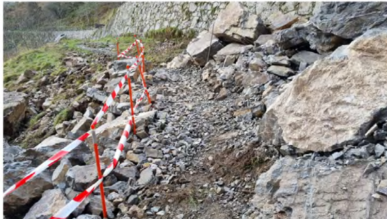
Paso provisional en el hundimiento de Culiembro. Febrero 2022

Actualmente (el 9 de febrero de 2022) se ha registrado un nuevo derrumbe en la zona de Culiembro (Cabrales; Asturias), que ha requerido de un especial esfuerzo de coordinación entre Repsol Generación Eléctrica y el Parque Nacional, al cortar los más de 400 m 3 de roca desprendidos de forma total el canal y comprometer gravemente el paso por la Ruta . De este modo, los trabajos declarados una vez más de emergencia por lo que se refiere a la reposición del paso por la Ruta 8 , se han desarrollado por TRAGSA, habiendo requerido de voladuras pirotécnicas y de un muy cuidadoso control de aproximación y retirada de materiales, ante la relativa cercanía del nido ocupado por la pareja reproductora de quebrantahuesos del Parque Nacional. Las obras finalizarán, salvo imprevistos, en la semana del 21 al 25 de marzo.