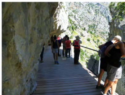
Turistas en la 'Pasarela de Los Martínez'

Como no puede ser de otra forma, la importancia de la Ruta del Cares en la economía de ambos Municipios es elevadísima, al ser el principal atractivo turístico de los mismos y uno de los principales del Parque Nacional, junto con la zona de Lagos de Covadonga y el ascenso en el teleférico de Fuente Dé.