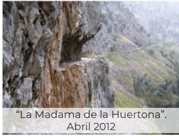
"La Madama de la Huertona". Abril 2012