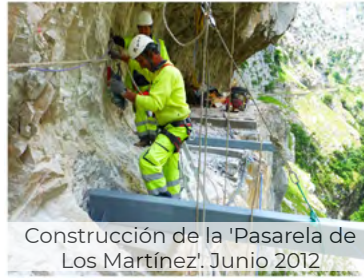
Construcción de la 'Pasarela de Los Martínez'. Junio 2012