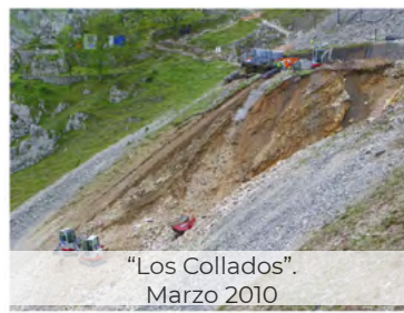
“Los Collados”. Marzo 2010