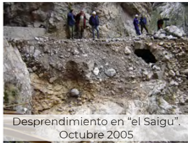
Desprendimiento en “el Saigu”. Octubre 2005