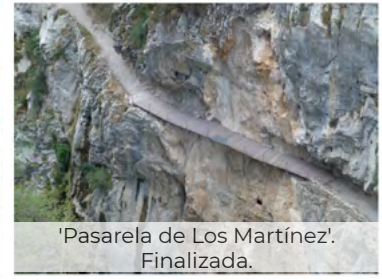
'Pasarela de Los Martínez'. Finalizada.

Actualmente (el 9 de febrero de 2022) se ha registrado un nuevo derrumbe en la zona de Culiembro (Cabrales; Asturias), que ha requerido de un especial esfuerzo de coordinación entre Repsol Generación Eléctrica y el Parque Nacional, al cortar los más de 400 m 3 de roca desprendidos de forma total el canal y comprometer gravemente el paso por la Ruta . De este modo, los trabajos declarados una vez más de emergencia por lo que se refiere a la reposición del paso por la Ruta 8 , se han desarrollado por TRAGSA, habiendo requerido de voladuras pirotécnicas y de un muy cuidadoso control de aproximación y retirada de materiales, ante la relativa cercanía del nido ocupado por la pareja reproductora de quebrantahuesos del Parque Nacional. Las obras finalizarán, salvo imprevistos, en la semana del 21 al 25 de marzo.