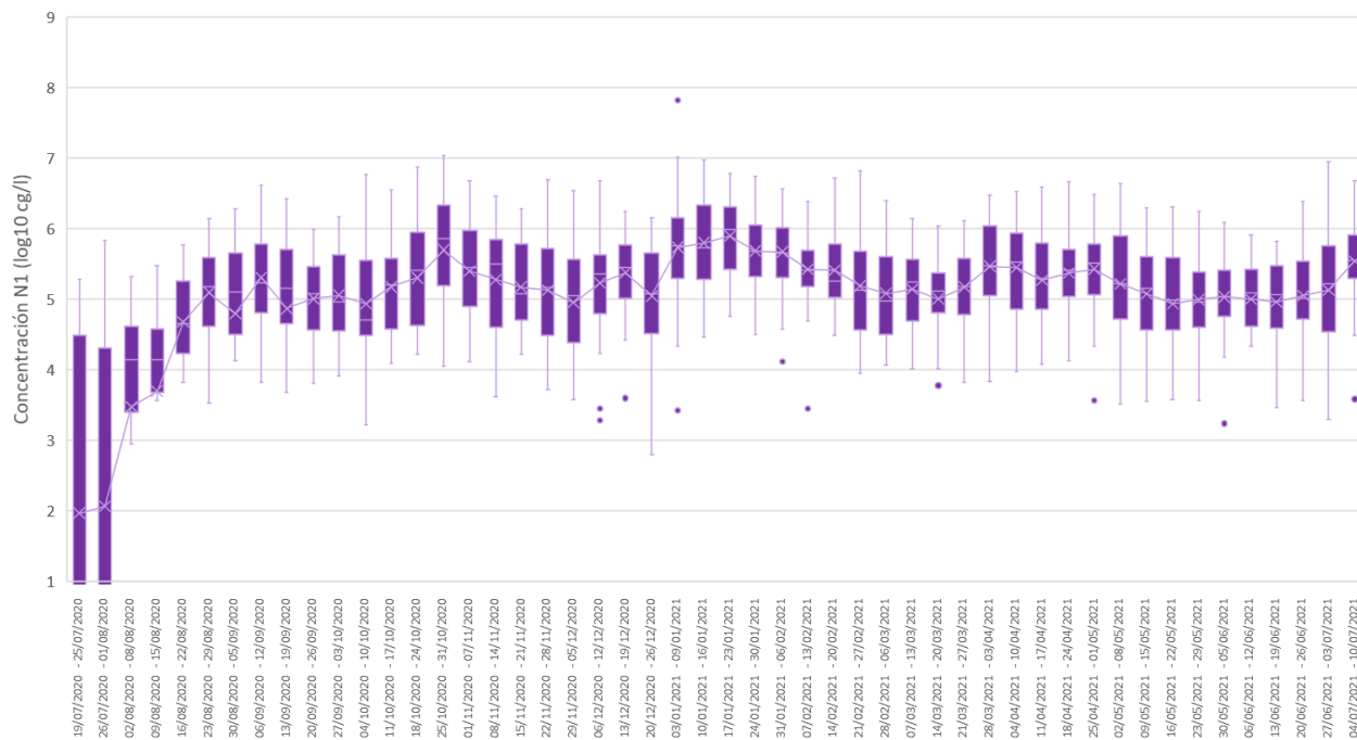
Niveles de las 38 EDAR agrupadas por semanas