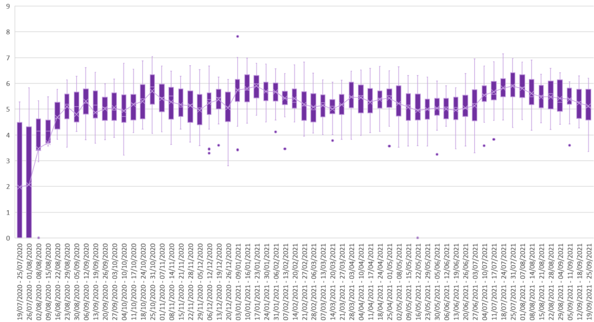
Niveles de las 38 EDAR agrupadas por semanas