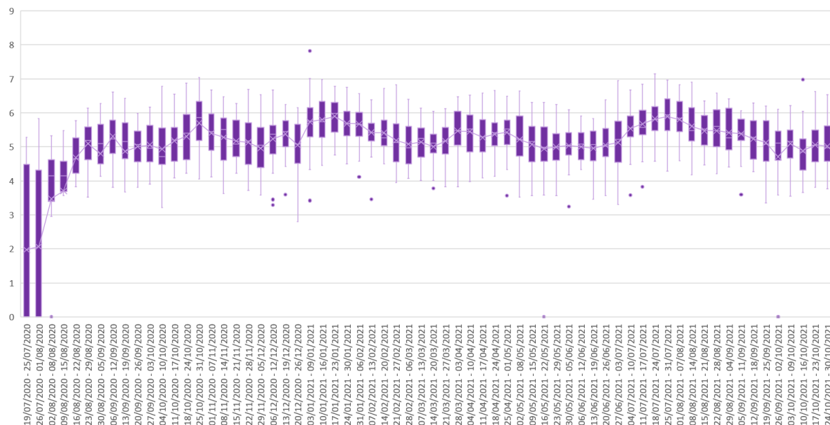
Niveles de las 38 EDAR agrupadas por semanas