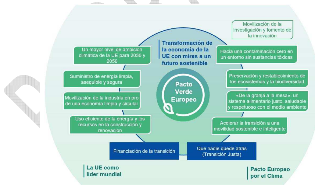
Figura 1. El Pacto Verde Europeo (Comisión Europea, 2019).

Por otra parte, muy consciente del necesario avance hacia una transición ecológica, la Unión Europea ha lanzado en diciembre de 2019 el denominado Pacto Verde Europeo (Figura 1), que incluye un conjunto de estrategias sectoriales alineadas y sinérgicas para la transformación de la economía de la UE con miras a un futuro sostenible. En el marco de este proceso, a transición ecológica que da nombre al Ministerio es un proceso transversal que tiene reflejo en todas las políticas sectoriales y que en el caso del agua exige revisar en profundidad las estrategias de intervención definidas en los actuales planes hidrológicos de segundo ciclo (2015-2021).