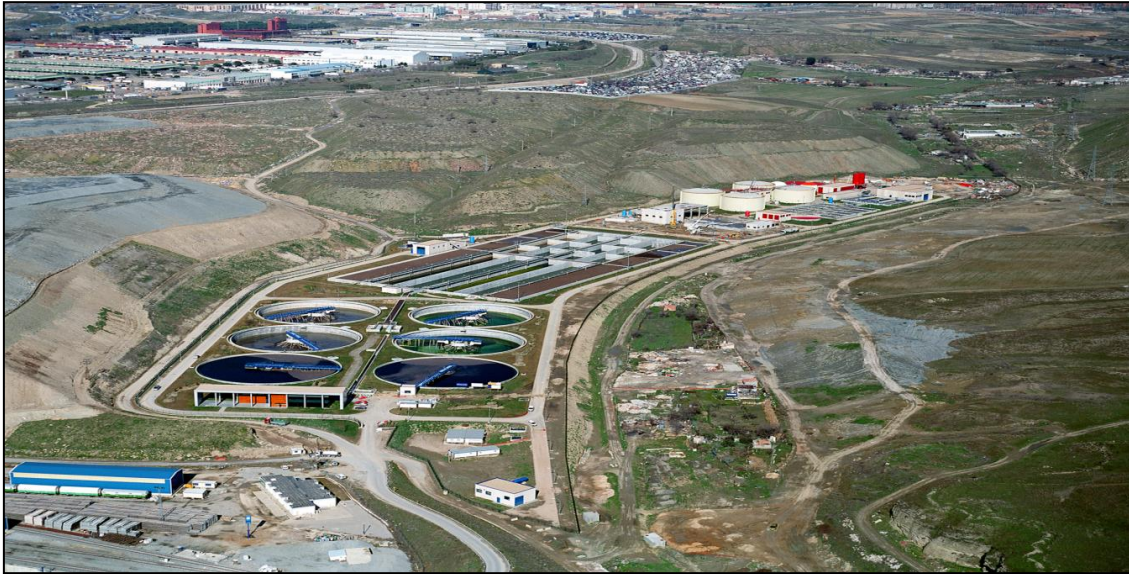
Ilustración 5: EDAR de La Gavia (Madrid).

La depuración implica un conjunto de procesos de tipo físico-químico y biológico que permiten la reducción de la contaminación, fundamentalmente orgánica, de los vertidos urbanos. También, y en función de las exigencias a los vertidos, se pueden incluir procesos para reducir la contaminación por nutrientes u otros.