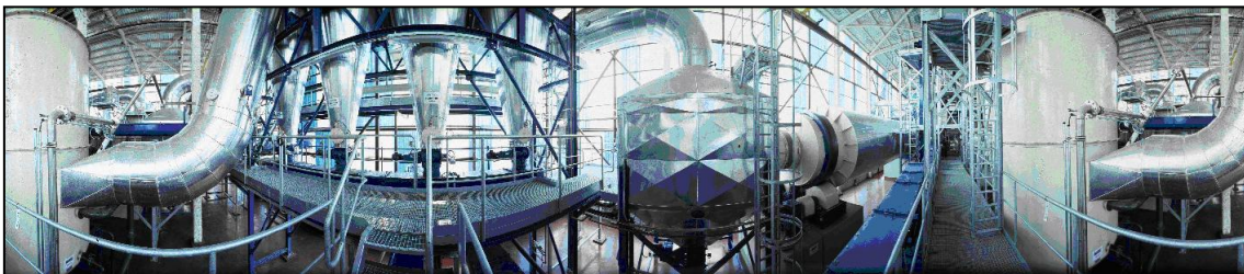
Ilustración 7: Secado térmico de fangos en EDAR.