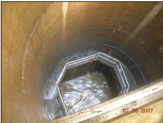
Ilustración 3: Pozo de caída excéntrica.

espacio, como son los pozos de caída excéntricos o vortex dropshaft en su acepción sajona (VDS).