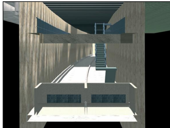
Ilustración 4: Modelo tridimensional de un estanque de tormentas.

Los retos planteados en el diseño de grandes redes de drenaje y saneamiento, exigen que las herramientas que se empleen permitan, con una flexibilidad cada vez mayor, abarcar desde el ámbito de la simulación de la escorrentía y la respuesta de las cuencas urbanas hasta el detalle de las obras de transporte, regulación, laminación y disipación de energía dentro de la red, así como las interacciones de la misma con el medio exterior, integrando asimismo aspectos hidráulicos y de calidad del agua.