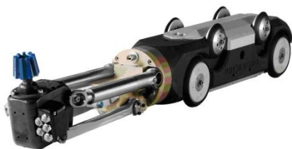
Ilustración 8: Robot para supervisión y Reparación.