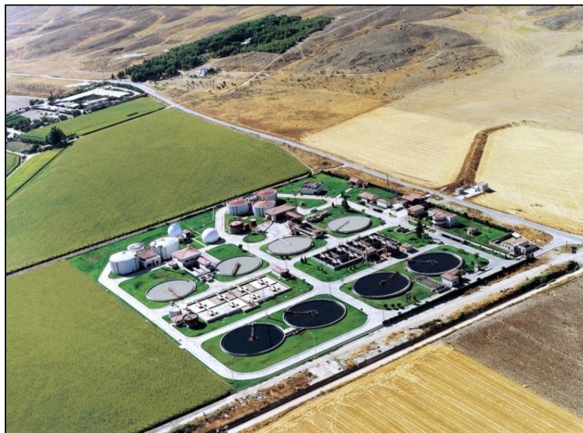
Ilustración 1: EDAR Sur Oriental (Madrid).

En la actualidad se depura el 80% del agua residual que producen los núcleos de población y sus industrias.