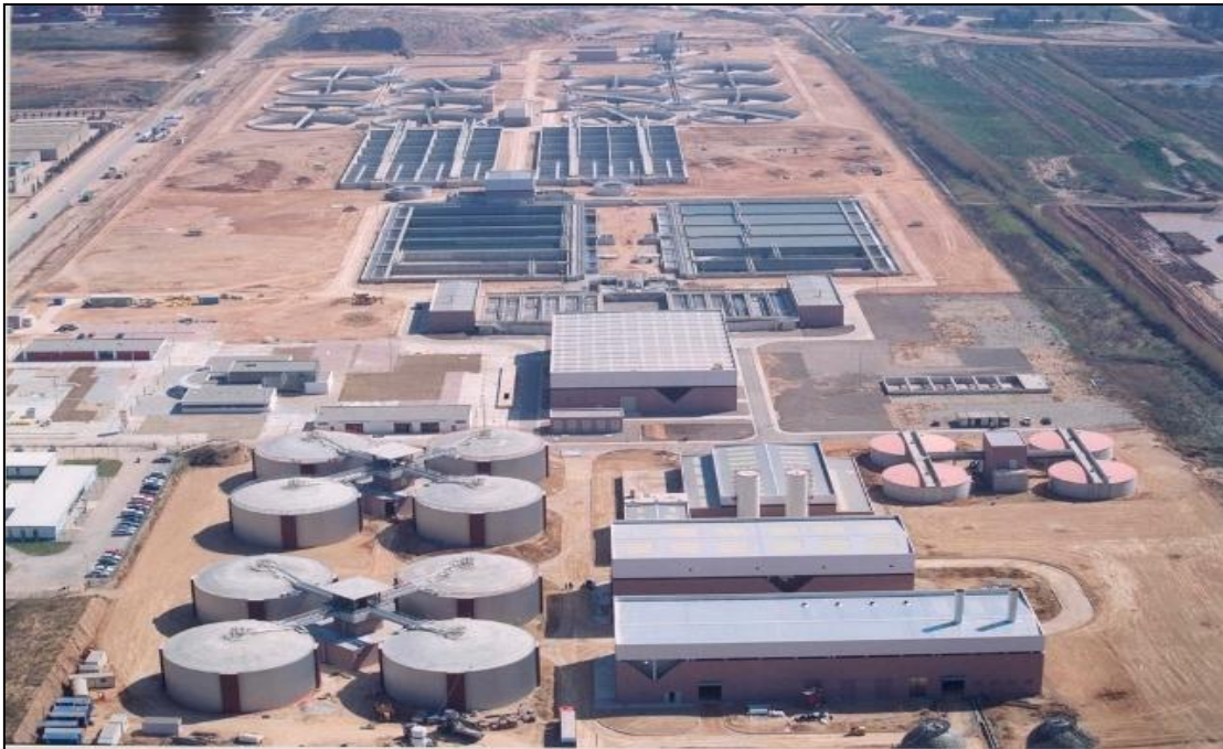
Ilustración 6: EDAR del Prat de Llobregat.