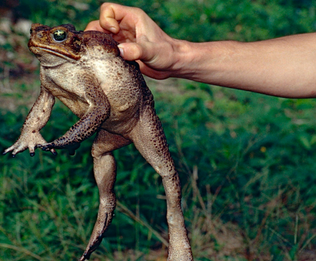
Sapo de la caña ( Rhinella marina )

Por último, cabe señalar que el objetivo del proyecto LIFE INVASAQUA, y por lo tanto de sus informes técnicos, es promover la colaboración y la coordinación con los encargados de la toma de decisiones y garantizar el intercambio y la puesta en común de los datos.