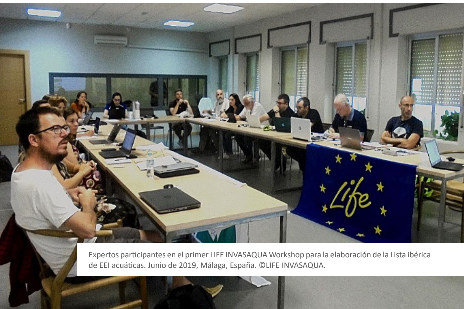
Expertos participantes en el primer LIFE INVASAQUA Workshop para la elaboración de la Lista ibérica de EEI acuáticas. Junio de 2019, Málaga, España.

El proceso de evaluación ha seguido un enfoque estructurado por etapas (CUADRO 2) que combina el conocimiento sobre las invasiones biológicas con la colaboración de expertos en la identificación y en la consolidación de resultados antes mencionada.