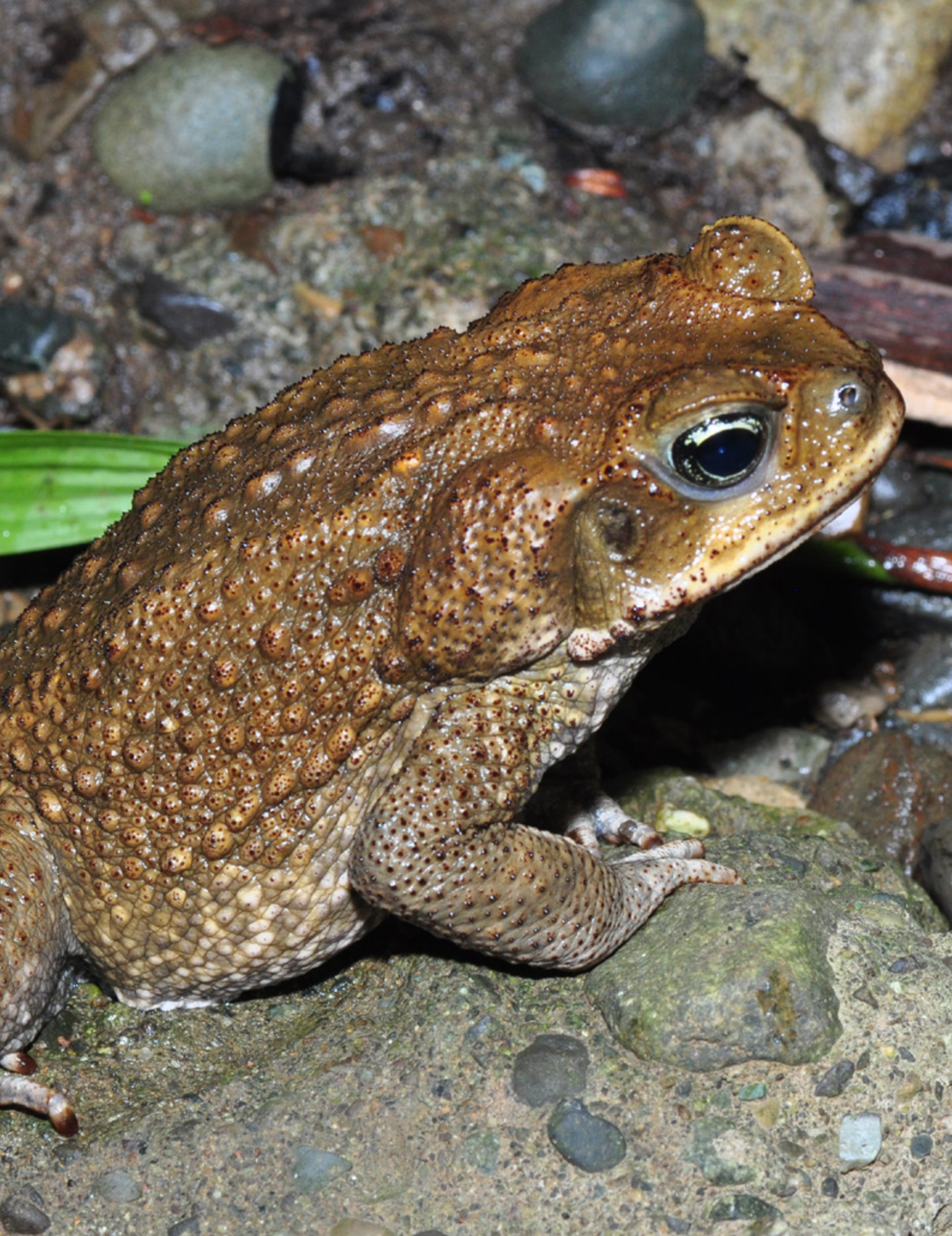
Sapo de la caña ( Rhinella marina )