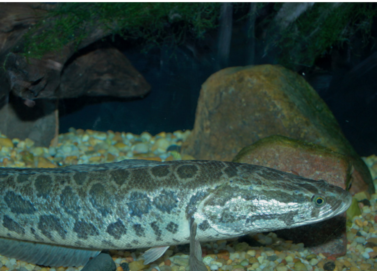
Pez cabeza de serpiente del norte ( Channa argus)