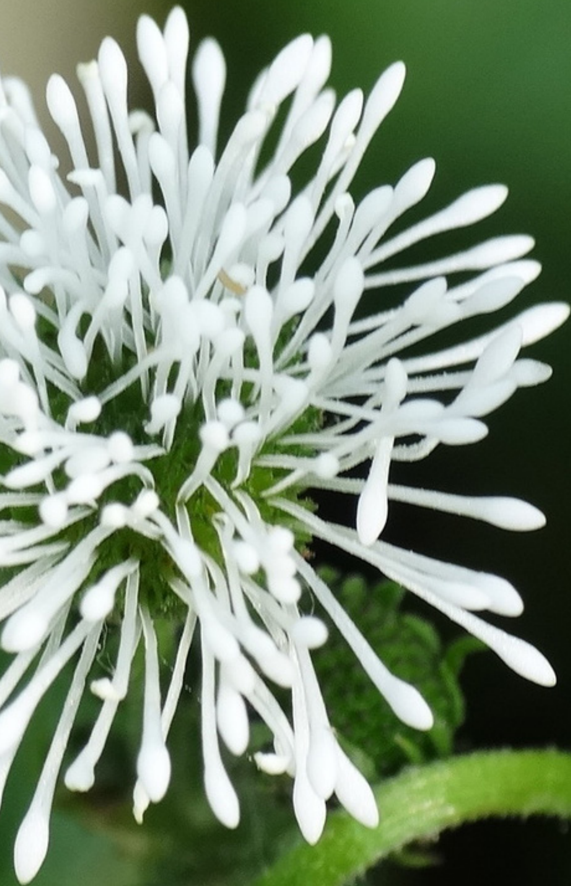
Planta de té de Senegal ( Gymnocoronis spilanthoides )