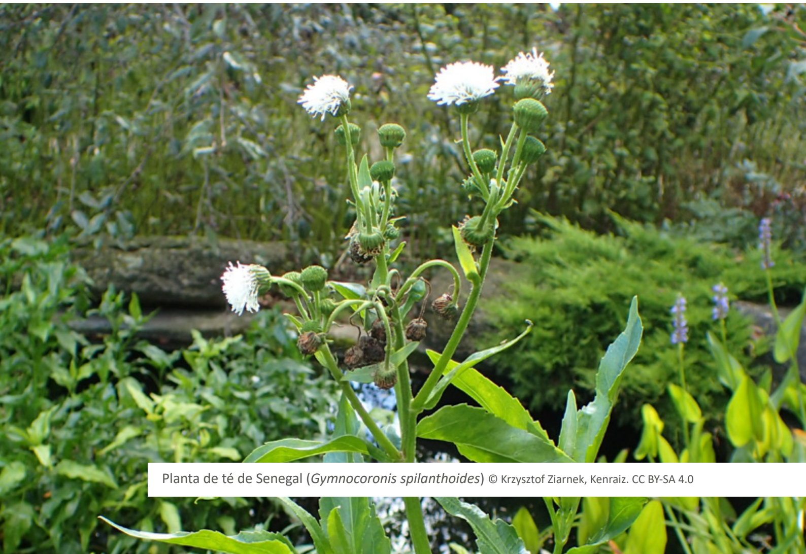
Planta de té de Senegal ( Gymnocoronis spilanthoides ) © Krzysztof Ziarnek, Kenraiz. CC BY-SA 4.0

El proyecto LIFE INVASAQUA ha demostrado ser una buena fuente de información sobre las EEI en España y Portugal, apoyando la aplicación del Reglamento de la UE sobre las EEI mediante la generación de conocimiento, la participación y la creación de sinergias entre responsables de la gestión y partes interesadas. En este sentido, se invitará a Autoridades de España y de Portugal con competencia en la aplicación de la Regulación sobre EEI, también a varias sociedades académicas, a que comprueben y validen la Lista que aquí se presenta.