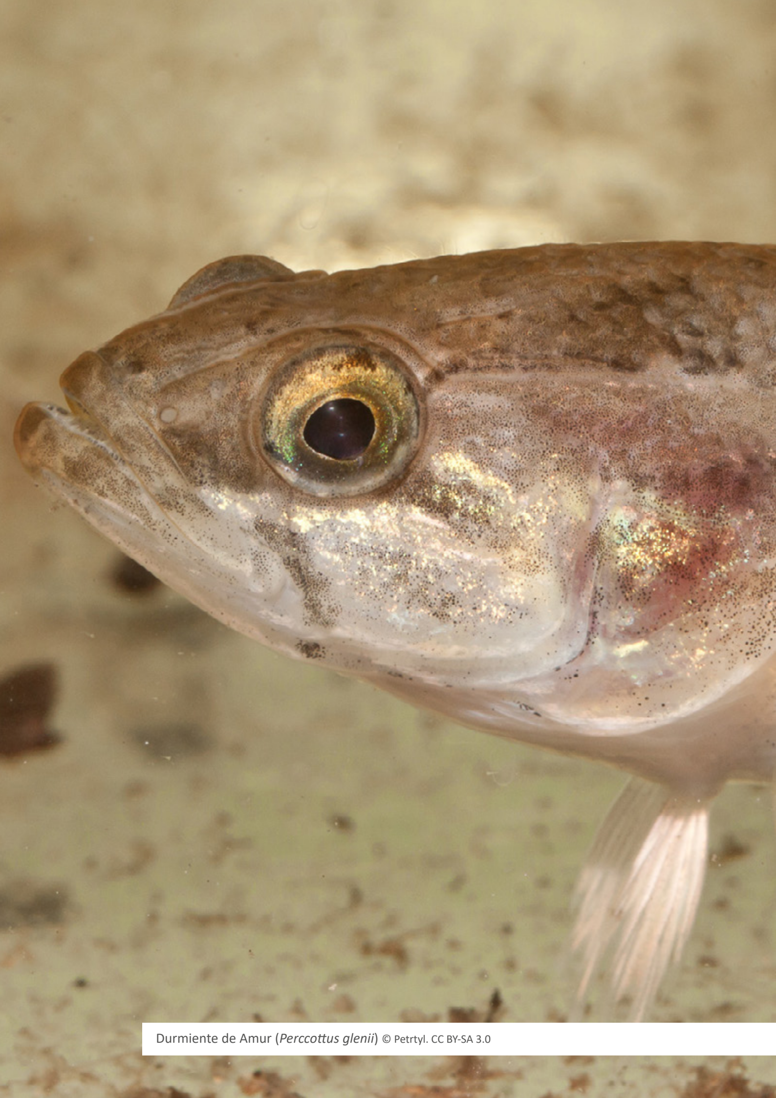
Durmiente de Amur ( Perccottus glenii )