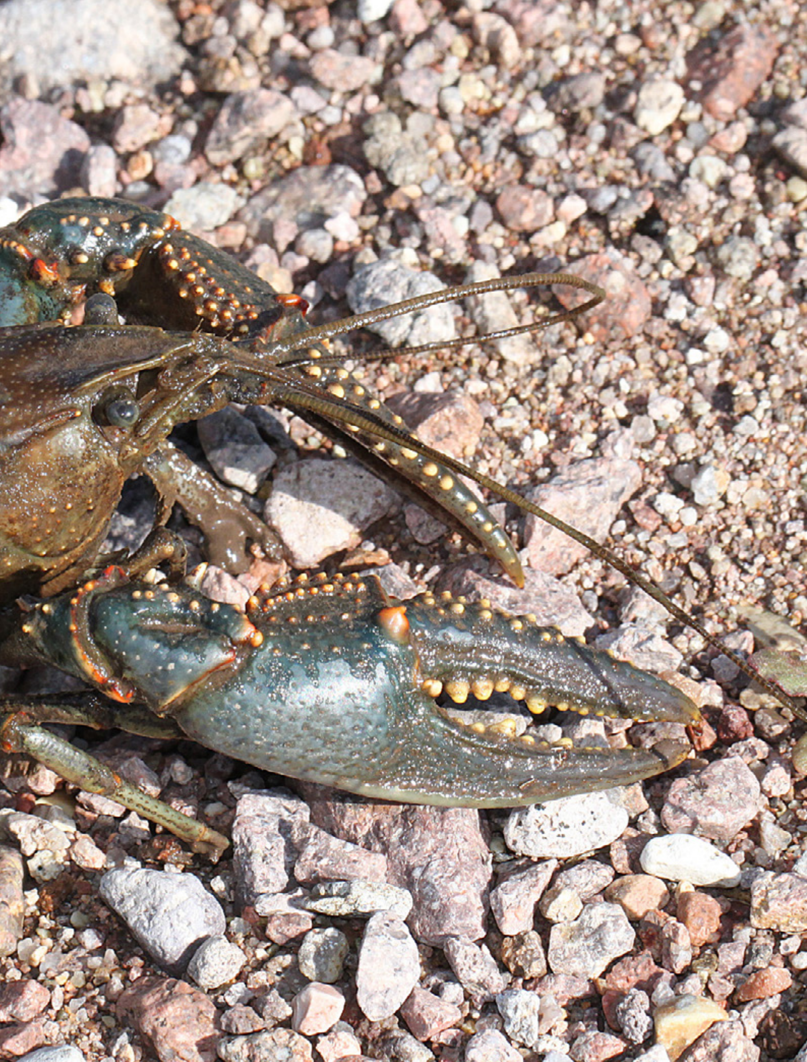
Cangrejo norteño ( Faxonius virilis )