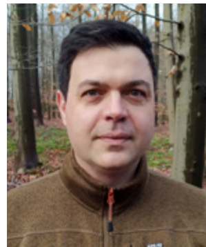
Spyridon Flevaris Comisión Europea

Las especies exóticas se definen típicamente como especies introducidas fuera de su área de distribución natural por intervención humana, de forma intencionada o involuntariamente. Dicha introducción es el primer paso del proceso de invasión: algunas especies exóticas se establecerán en su nuevo entorno produciendo efectos adversos sobre la biodiversidad. Éstas se denominan especies exóticas invasoras y son una de las cinco causas principales de la pérdida de biodiversidad. Recientes investigaciones han demostrado que a nivel mundial existe una tendencia creciente y acelerada de nuevas introducciones de especies exóticas y, por consiguiente, del número de posibles especies exóticas invasoras.