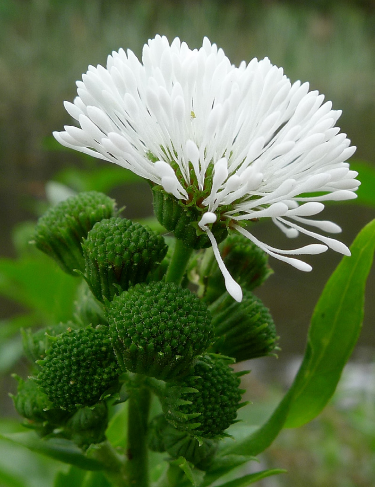
Planta de té de Senegal ( Gymnocoronis spilanthoides ) © John Tann. CC BY 2.0