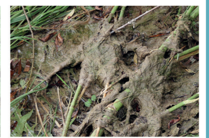
Moco de roca

El contenido de este documento refleja únicamente las opiniones de sus autores y la Unión Europea/EASME no se hace responsable del uso que pueda hacerse de la información contenida en él.