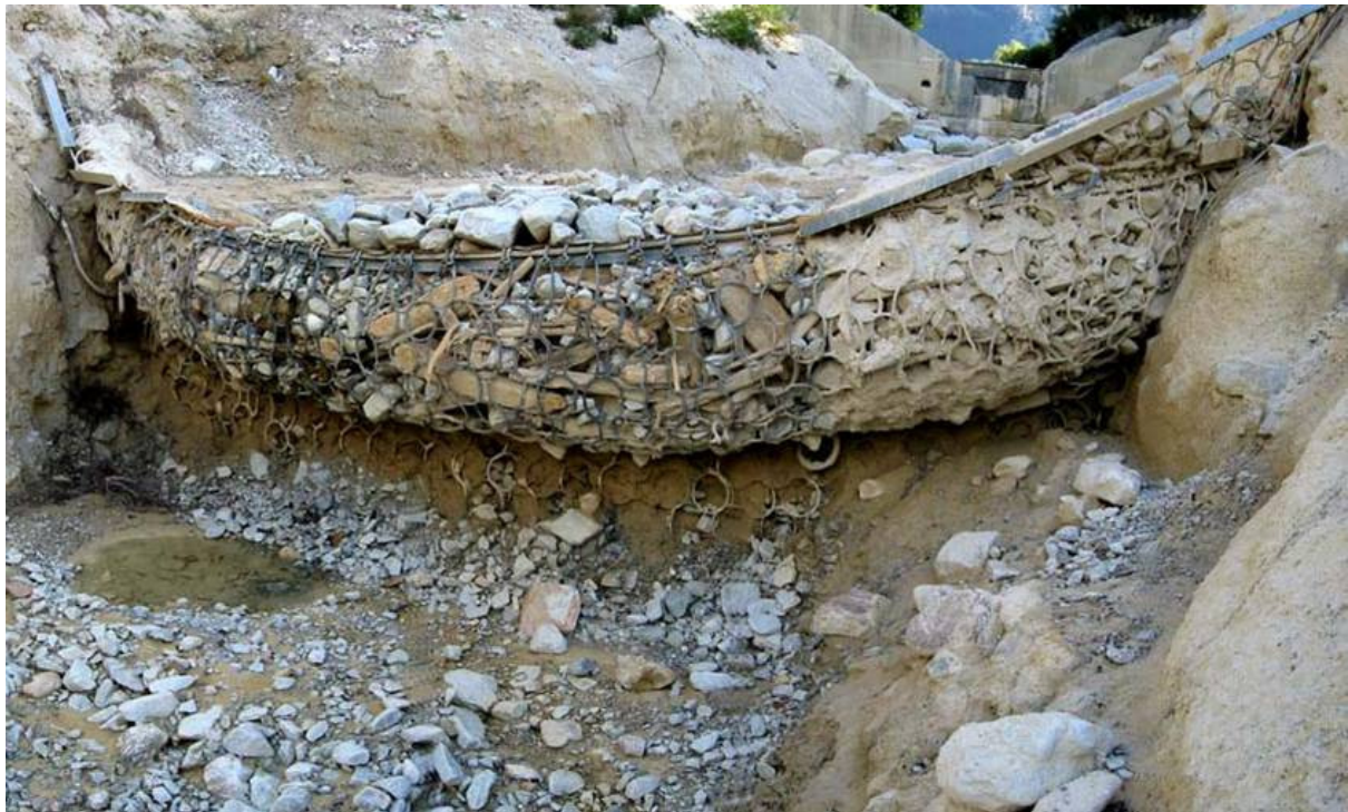
Diques de cable.