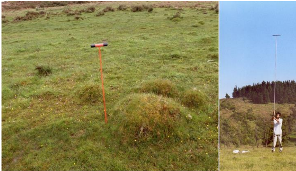
Figura 1 Sonda de presondeo: en fibra de vidrio (diámetro: 19 mm, longitud: 105 cm) o en acero (diámetro 30 mm, longitud: 10 m). Autor: Xabier Pontevedra Pombal.