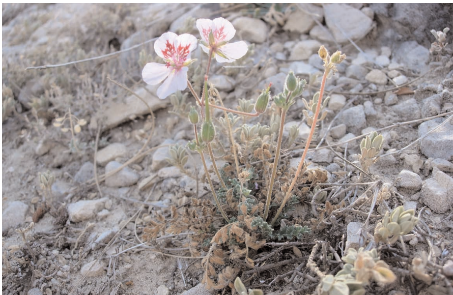
Alfilerillos de Cazorla

Planta endémica del macizo de la Sierra de Cazorla (Jaén), en sentido amplio, apareciendo en las sierras colindantes de las provincias de Granada y Albacete. Se encuentra especialmente amenazada por la excesiva herbivoría, su escasa plasticidad ecológica y algunas obras en sus poblaciones (apertura de carriles, instalaciones de antenas, etc.).