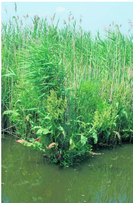
J. van der Straaten © Saxifraga Foundation