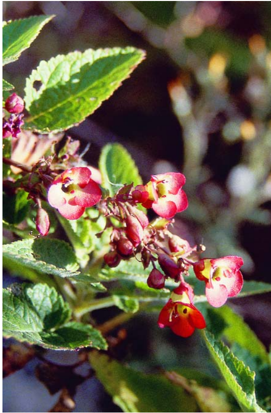
Bella de risco

Taxón con efectivos muy reducidos y en declive por la explotación de acuíferos, habiendo desaparecido en algunas localidades.