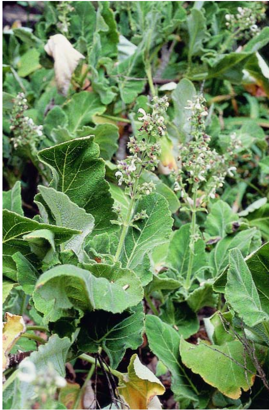
Salvia, oreja de burro

Especie distribuida en dos poblaciones aisladas geográficamente y cuya principal amenaza corresponde al sobrepastoreo existente en sus inmediaciones.