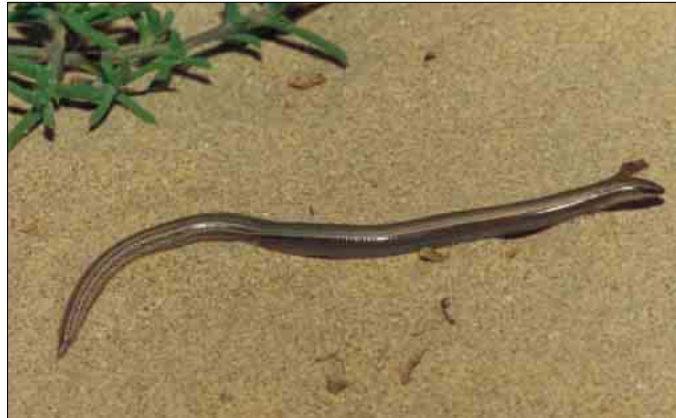
Ejemplar del litoral noreste de Marruecos

Especie de aspecto vermiforme, de extremidades muy reducidas que delatan un comportamiento excavador en los medios arenosos en los que se le encuentra. Su área de distribución, además de discontinua, está restringida a una estrechísima franja litoral mediterránea situada entre la península del cabo de Tres Forcas y las inmediaciones de la capital argelina, donde se han dado las citas más orientales (DOUMERGUE, 1901; BONS & GENIEZ, 1996). Era relativamente común en la desembocadura del Río Muluya, pero últimamente las observaciones en esta zona son escasas y difíciles de obtener (S. FAHD, obs, per); falta en el pequeño archipiélago de Chafarinas, situado justo en frente. La única localidad española de la especie está localizada en el extremo sur del territorio melillense, en una zona conocida como La Hípica. De allí procede una cita antigua (Colección de la Estación Biológica de Doñana), y otra más reciente citada por MATEO (1997).