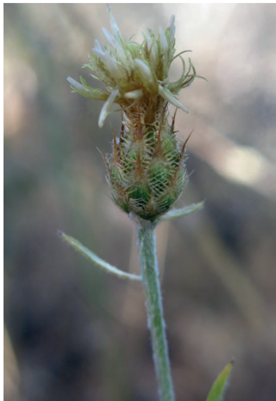
Escobilla de Despeñaperros