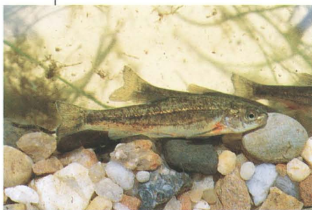
Población del Duero.

España: es una especie endémica de la Península Ibérica. Se distribuye por las cuencas de los ríos Tajo, Guadiana, Guadalquivir y Odiel, así como en los ríos de la zona suroeste de la cuenca del Duero (Uces, Turones, Yeltes y Huebra principalmente).