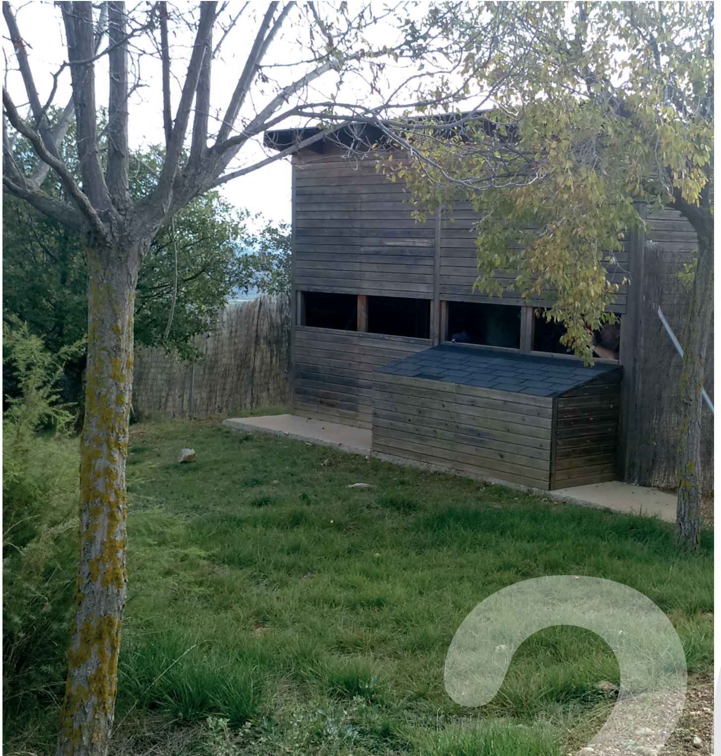
Banco de datos de la Naturaleza (MAGRAMA) Observatorio de Aves de Alquézar. Parque Natural de la Sierra y Cañones de Guara