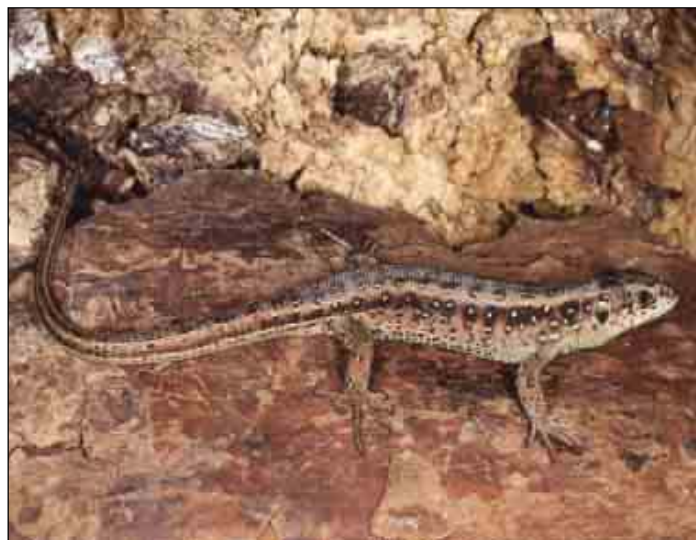
Ejemplar juvenil, Girona.

Las poblaciones pirenaicas de lagarto ágil pueden presentar en ocasiones densidades altas pero, al hallarse muy restringidas geográficamente, son muy sensibles a la fragmentación y al deterioro del hábitat