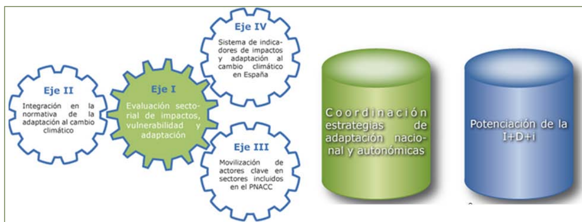
Figura 4. Ejes y pilares del ciclo de la adaptación al cambio climático