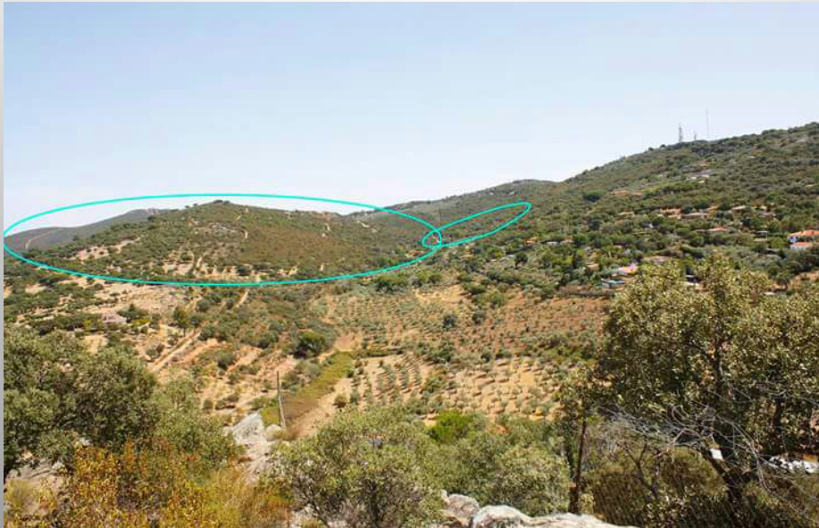
Ubicación colindante a urbanizaciones que serían expropiadas y a menos de 2km de la ciudad monumental de Cáceres