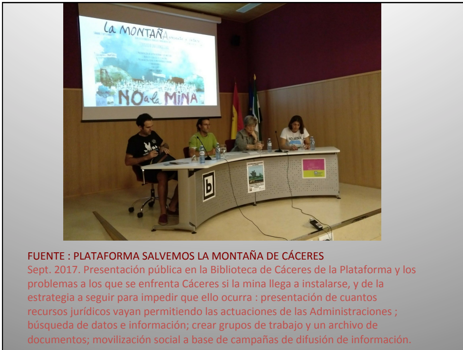
FUENTE : PLATAFORMA SALVEMOS LA MONTAÑA DE CÁCERES Sept. 2017. Presentación pública en la Biblioteca de Cáceres de la Plataforma y los problemas a los que se enfrenta Cáceres si la mina llega a instalarse, y de la estrategia a seguir para impedir que ello ocurra : presentación de cuantos recursos jurídicos vayan permitiendo las actuaciones de las Administraciones ; búsqueda de datos e información; crear grupos de trabajo y un archivo de documentos; movilización social a base de campañas de difusión de información.