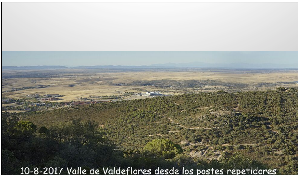
10-8-2017 Valle de Valdeflores desde los postes repetidores

Vista del emplazamiento de los trabajos de investigación Mina Valdeflores, en la montaña de Cáceres, previos a la explotación