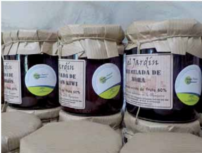
Productos El Jardín

E l Parque Nacional y Parque Natural de Sierra Nevada es el espacio andaluz que cuenta con mayor número de productos y servicios certificados con la marca Parque Natural de Andalucía, un total de 225, repartidos entre turismo de naturaleza, productos artesanales y naturales.