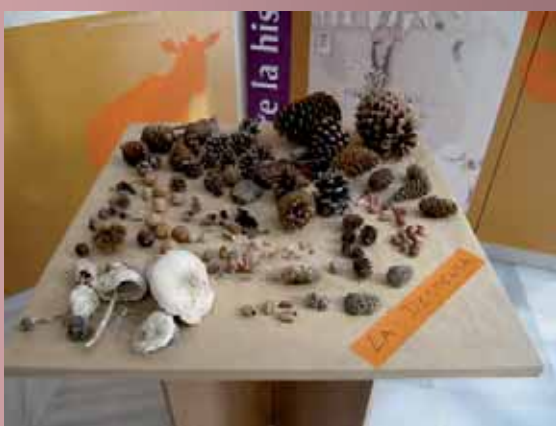
Al-Mihras Turismo Activo ha mejorado la dotación interpretativa del Centro de Visitantes Lujar de Andarax.