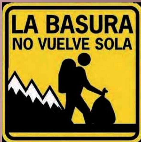
El Taller de Jarapas Hilacar organiza la campaña "Borrando huellas", destinada a eliminar residuos abandonados del monte.