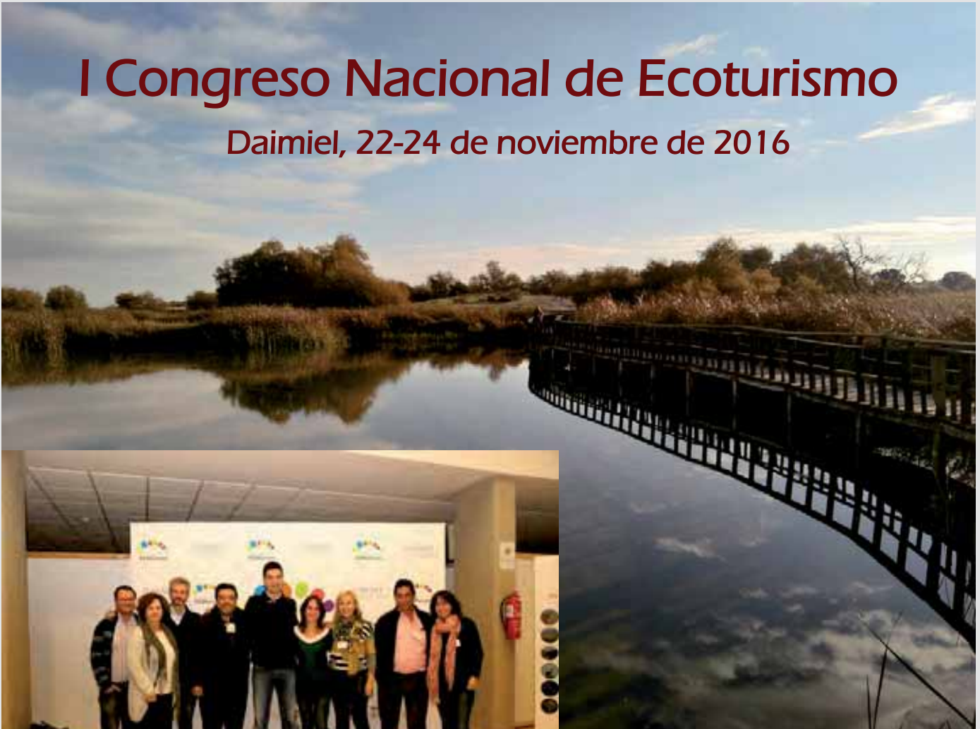
Representantes de la Consejería de Medio Ambiente y Ordenación del territorio, participantes en el Congreso Nacional de Ecoturismo.

D el 22 al 24 de noviembre de 2016 se celebró en Daimiel el I Congreso Nacional de Ecoturismo , organizado por la Secretaría de Estado de Turismo, el Organismo Autónomo de Parques Nacionales y el Ayuntamiento de Daimiel.