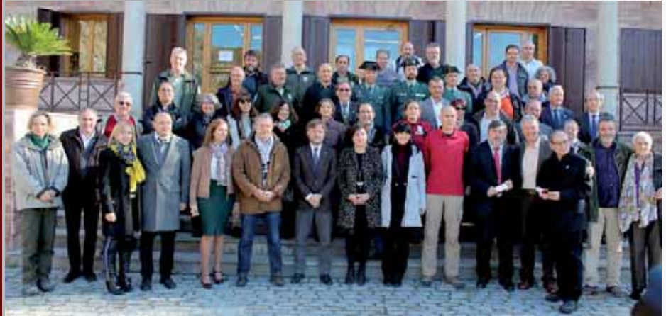
Participantes y galardonados en los actos de conmemoración del Centenario de la Ley de Parques Nacionales.