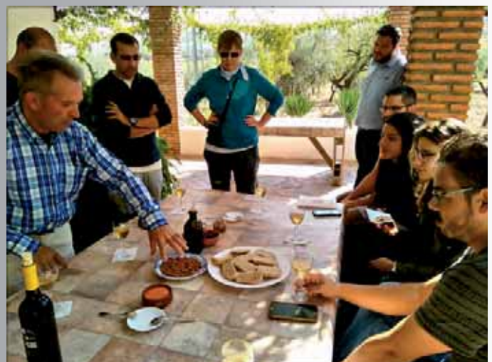
Durante la visita al Cortijo El Cura.

En el programa se incluyó igualmente una salida práctica al territorio para visitar buenos ejemplos de turismo sostenible, y en este caso Al-Mihras Turismo Activo, guió la actividad por la Alpujarra almeriense, dando a conocer las experiencias del Cortijo El Cura y el Hotel Almiraz, ambos en Laujar de Andarax.