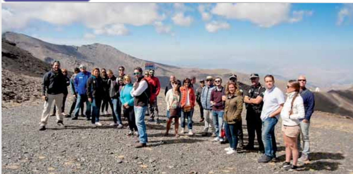
Participantes en las jornadas formativas del SICTED

E l día 3 de noviembre el Espacio Natural de Sierra Nevada fue evaluado por el SICTED para comprobar el cumplimiento de unos estándares de buenas prácticas, de manera que se garantice que el usuario recibe un nivel de excelencia y confort en el destino turístico.