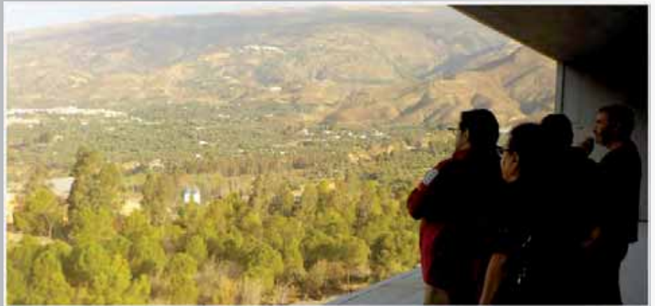
Nueva sede de la Cooperativa Las Torcas, en Tablonos

A través del programa de intercambio del Organismo Autónomo de Parques Nacionales, los directores de los Parques Nacionales del Teide y de Aigüestortes y Lago de San Mauricio, visitaron el Parque Nacional de Sierra Nevada para conocer algunos proyectos de interés, susceptibles de extrapolar a sus espacios protegidos, y entre ellos, la Carta Europea de Turismo Sostenible.