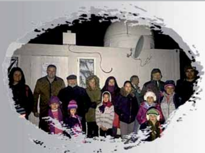
“Velada astronómica”. El cielo de Sierra Nevada como recurso turístico por “al-natural”-Ecoturismo.