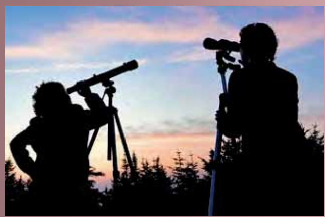
Alojamiento Rural El Valle ha creado una nueva experiencia de astroturismo para niños.