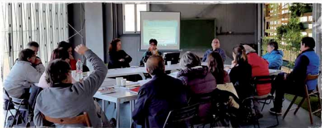
Participantes del Foro CETS Sierra Nevada

E l 16 de noviembre, en la sede de la Cooperativa Las Torcas, en Tablones, fue convocado el Foro CETS Sierra Nevada, con una asistencia de 18 participantes, entre entidades públicas y privadas.