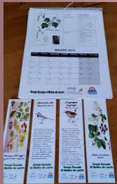
El Molino de Lecrín ha identificado la fauna y flora cercana al establecimiento y ha elaborado con ello materiales para su difusión (folleto, marcapáginas, etc.)