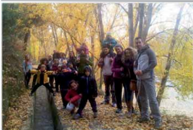
“Sierra nevada en familia”, por el Aula de Naturaleza Ermita Vieja.