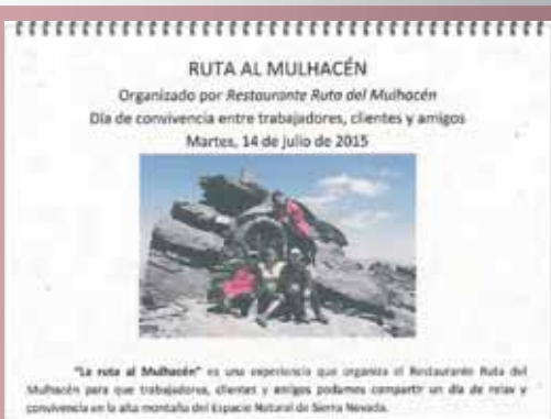
Restaurante Ruta del Mulhacén organiza anualmente una ruta al Mulhacén para vivir un día de convivencia con clientes y trabajadores.