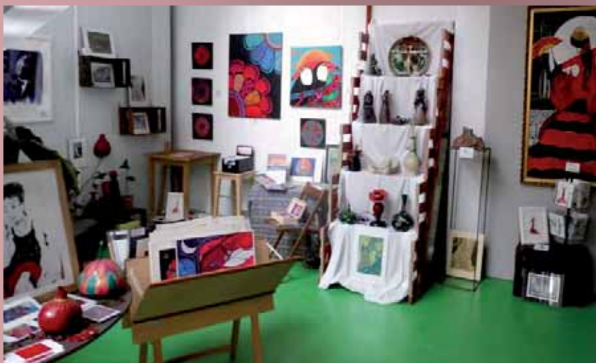
Cooperativa Las Torcas ha destinado un espacio para que pintores, artesanos y escultores entre otros muestren su arte a los visitantes.