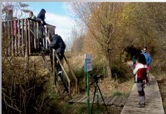
“Descubriendo el humedal del Padul”. La fauna de Sierra Nevada como recurso turístico, por el Aula de Naturaleza Ermita Vieja.