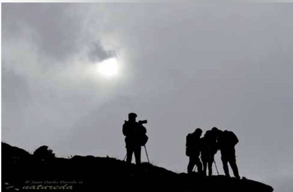
“Ruta fotográfica”. El paisaje de Sierra Nevada como recurso turístico, por Natureda.