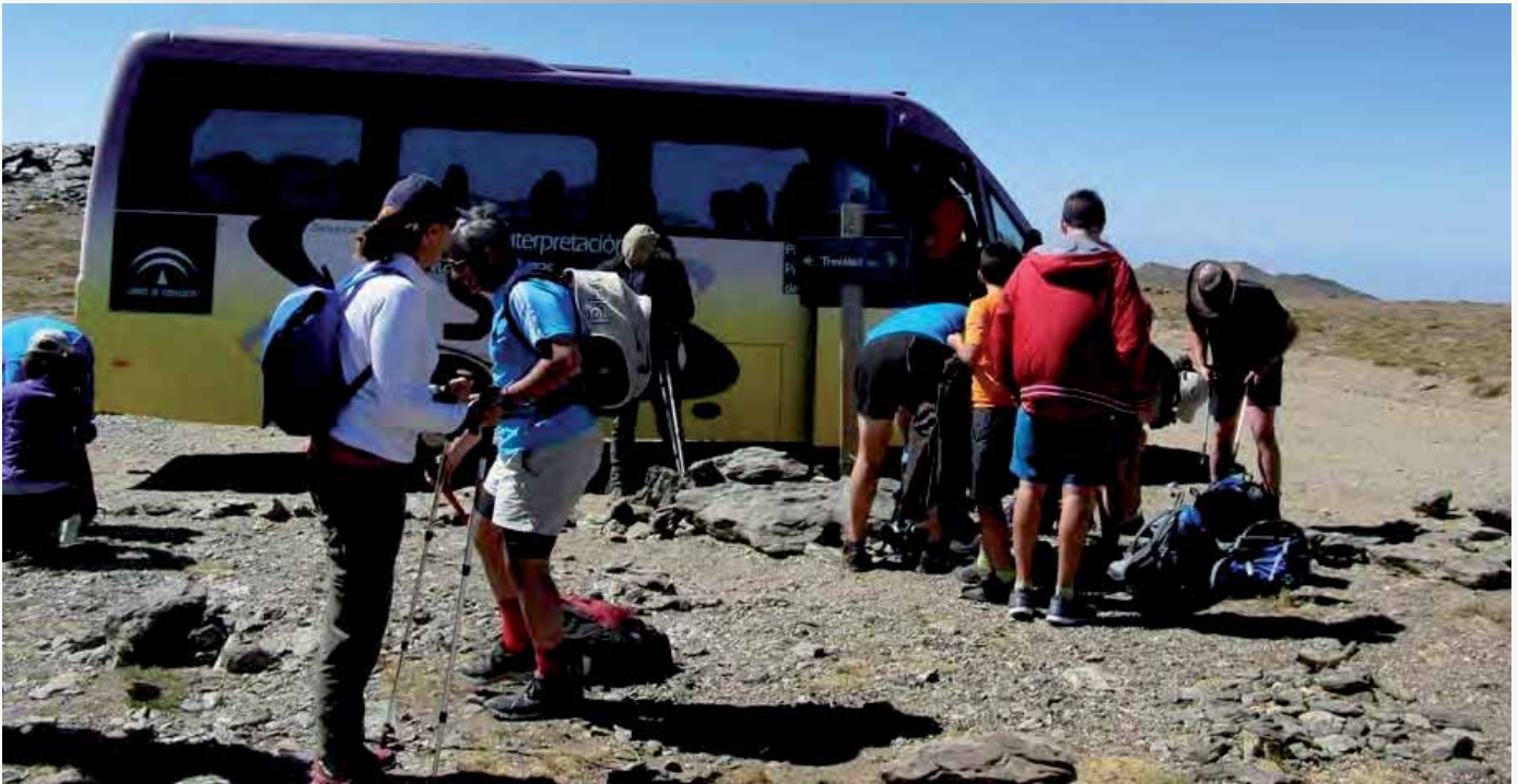
Servicio de Interpretación de Altas Cumbres

Con la finalidad de trabajar en colaboración con el equipo de gestión del Espacio Natural de Sierra Nevada para la ordenación de accesos a zonas sensibles del espacio protegido, como es la zona de cumbres, se ha creado un grupo de trabajo en el seno del Foro de la CETS, formado principalmente por las empresas que ofrecen actividades de naturaleza en el territorio.