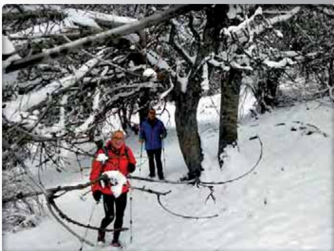
“Desde el Collado del Alguacil a la Dehesa del Camarate”. La flora y la ganadería de Sierra Nevada como recurso turístico, por Sierra&Sol.