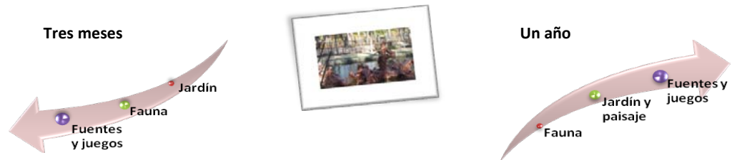
Gráfica 4: EPO en La Granja de San Ildefonso

La cuestión principal que se hace a los alumnos es acerca de lo que recuerdan de la actividad que han hecho. La información de respuesta se ofrece en las gráficas que se presentan a continuación.