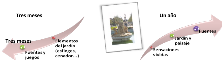
Gráfica 5: EPO en Aranjuez