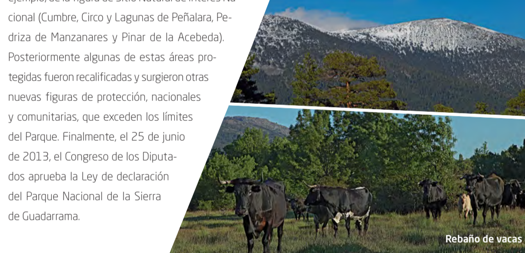
Pino silvestre y Macizo de Peñalara

La explotación forestal de los pinares de la Sierra de Guadarrama ha sido uno de los aprovechamientos tradicionales más importantes. Sin embargo, desde hace años, la mayoría de las masas boscosas del Parque Nacional tienen asignada la función de conservación de la biodiversidad y el paisaje, la protección del suelo, el control hidrológico y el recreo, continuando la explotación forestal en la zona periférica de protección. Merece mencionarse el caso del Pinar de Valsain, ejemplo emblemático de aprovechamiento sostenible y de conservación de la naturaleza, del que la parte perteneciente a la Zona Periférica de Protección (ZPP), posee un régimen jurídico especial, a raíz de la declaración del Parque, que en la práctica la equipara a este.