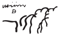
RED DE PARQUES NACIONALES