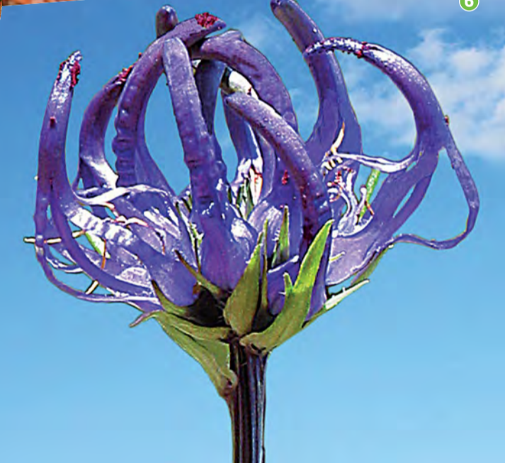
6 Cuernecillo azul · Phyteuma hemisphaericum