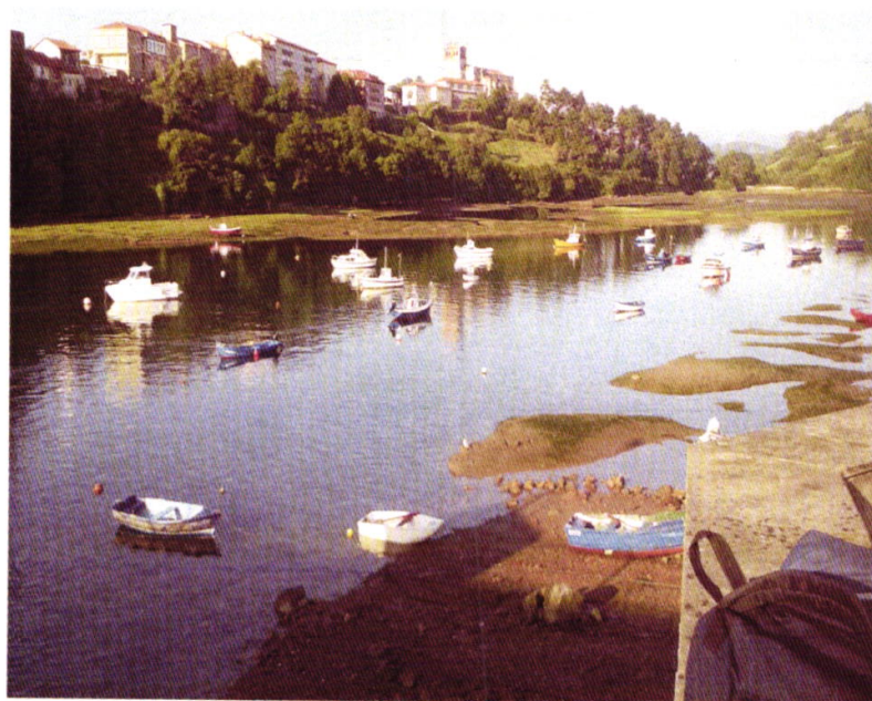
2. Fotografía actual de la ría donde solicitamos transitar.