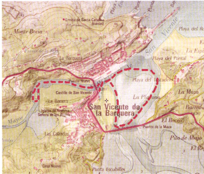
1. Plano del recorrido ampliado