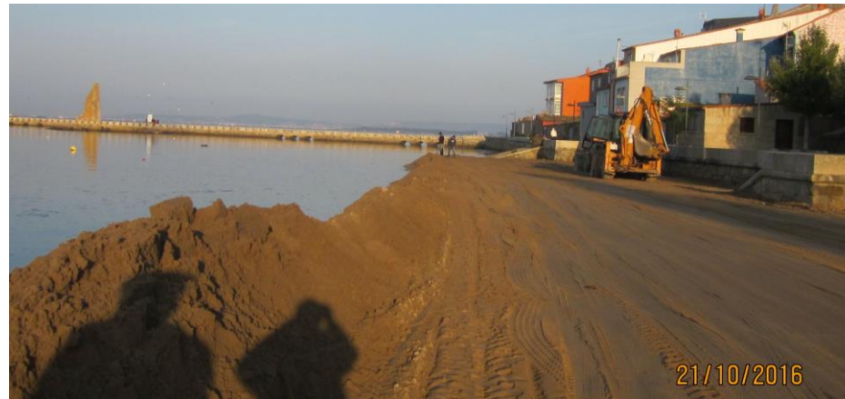
Durante la obra