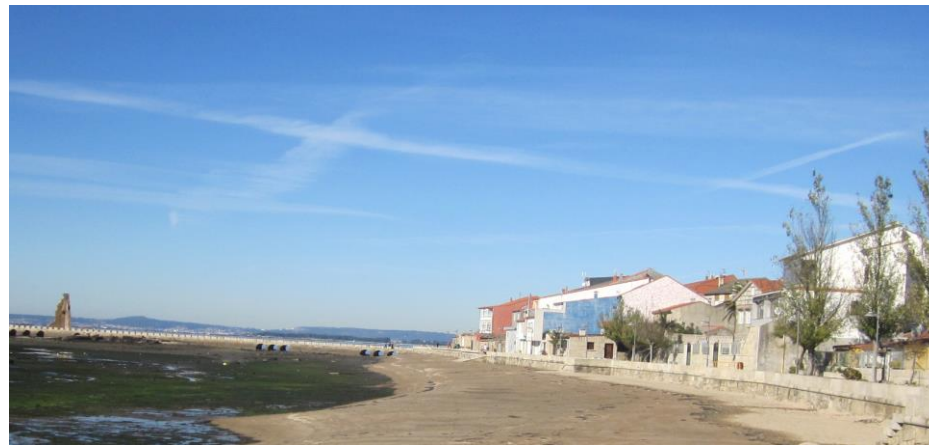
Después de la obra