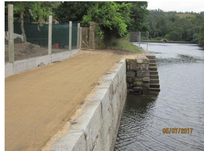
Después de la obra