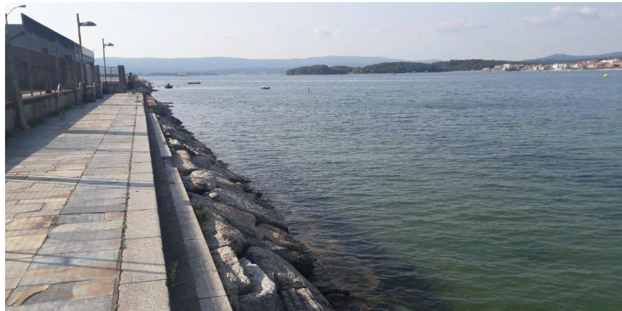
Después de la obra