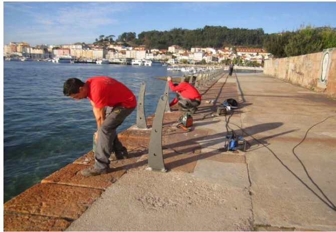
Durante la obra