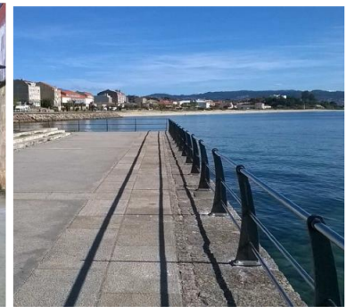
Después de la obra