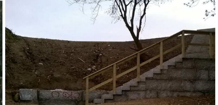
Después de la obra