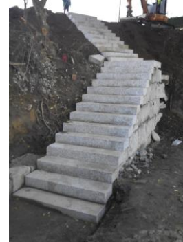
Durante la obra