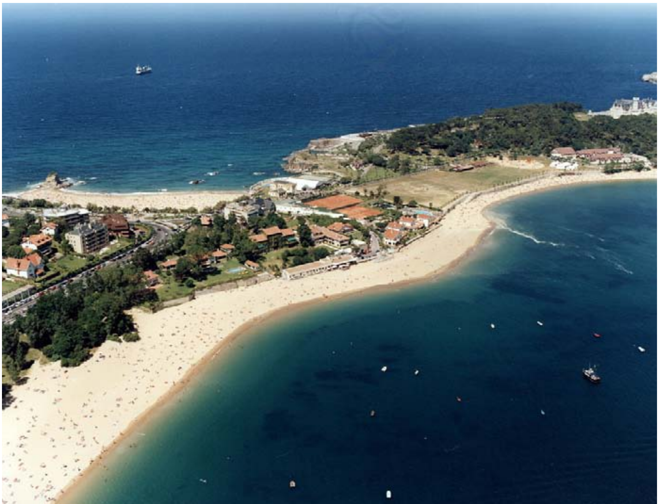
LOCALIZACION DE LA ACTUACION

Las operaciones de carga y vertido de arena se realizarán mediante un equipo de maquinaria de gran tonelaje formado por 2 retros de cadenas de 40 T, 2 dumper de 40 T, y un bulldozer D-8. Se extrae la arena en la bajamar en la zona de acumulación de la rampa de la Fenómeno, en los Peligros, y se vierte frente al balneario de la Magdalena