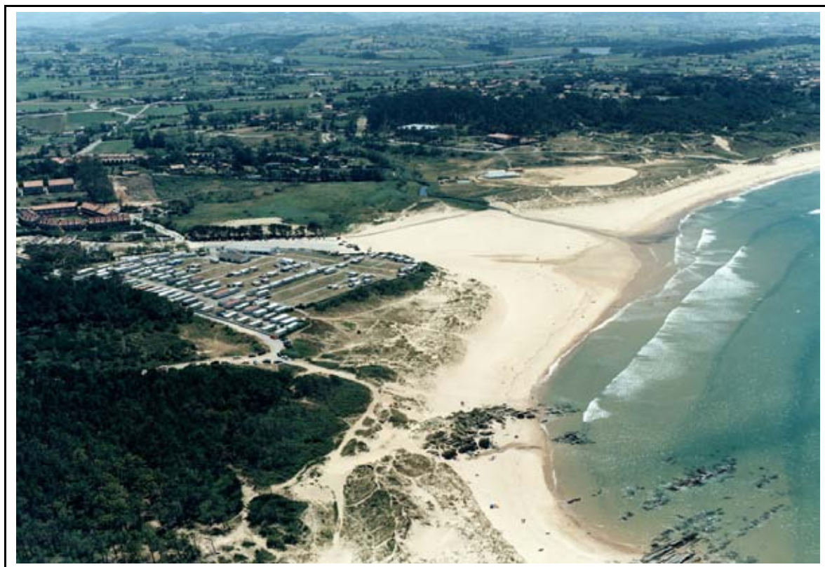
LOCALIZACION DE LA ACTUACION

Se realiza la plantacion de 20,000 plantas de Ammophila arenaria para regenerar la zona donde se ubicaba el antiguo tramo de pasarela y la zona afectada por el transito del personal de obra y acopio de madera, segun los condicionantes dados por la Direccion General de Montes y Conservación de la Naturaleza del Gobierno de Cantabria de fecha 11/02/2013