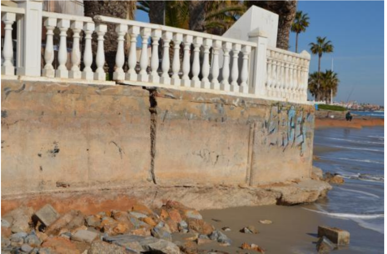
Pilar de la Horadada