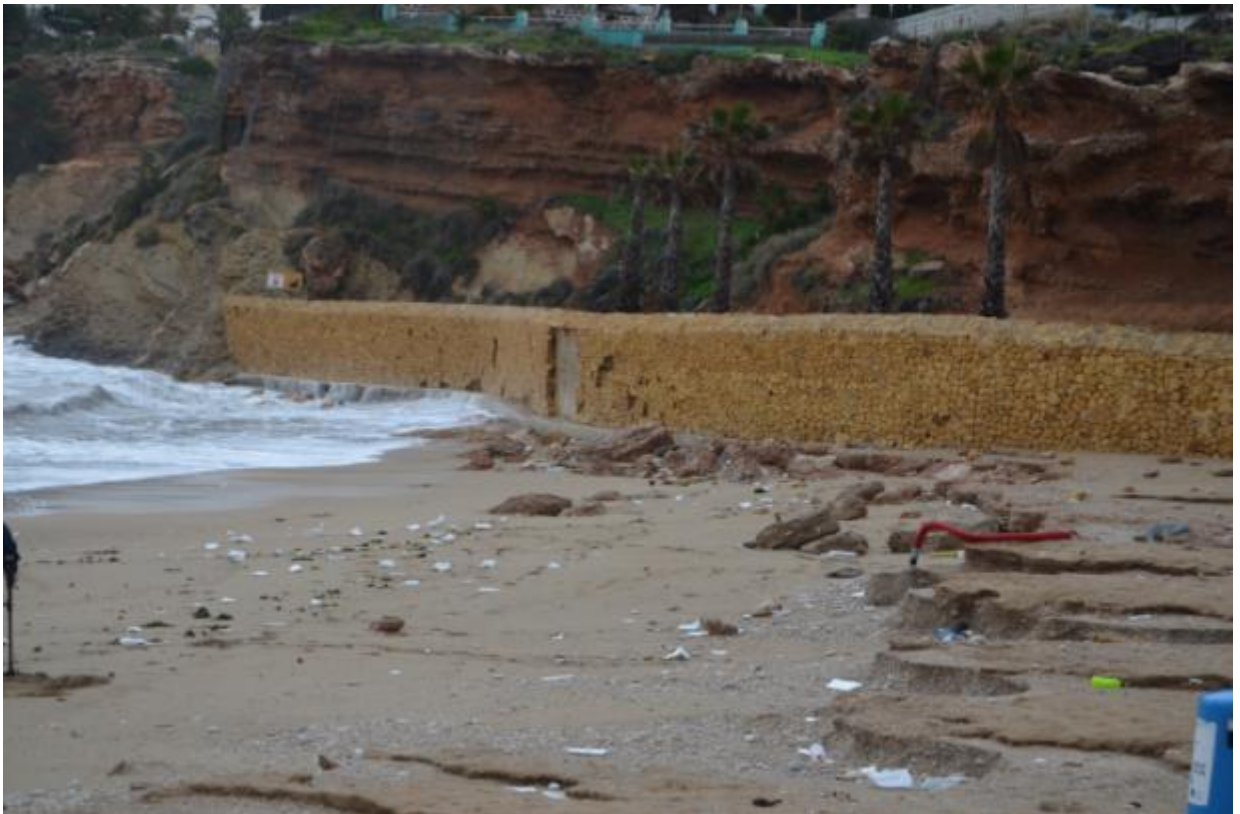
L'Alfàs del Pi