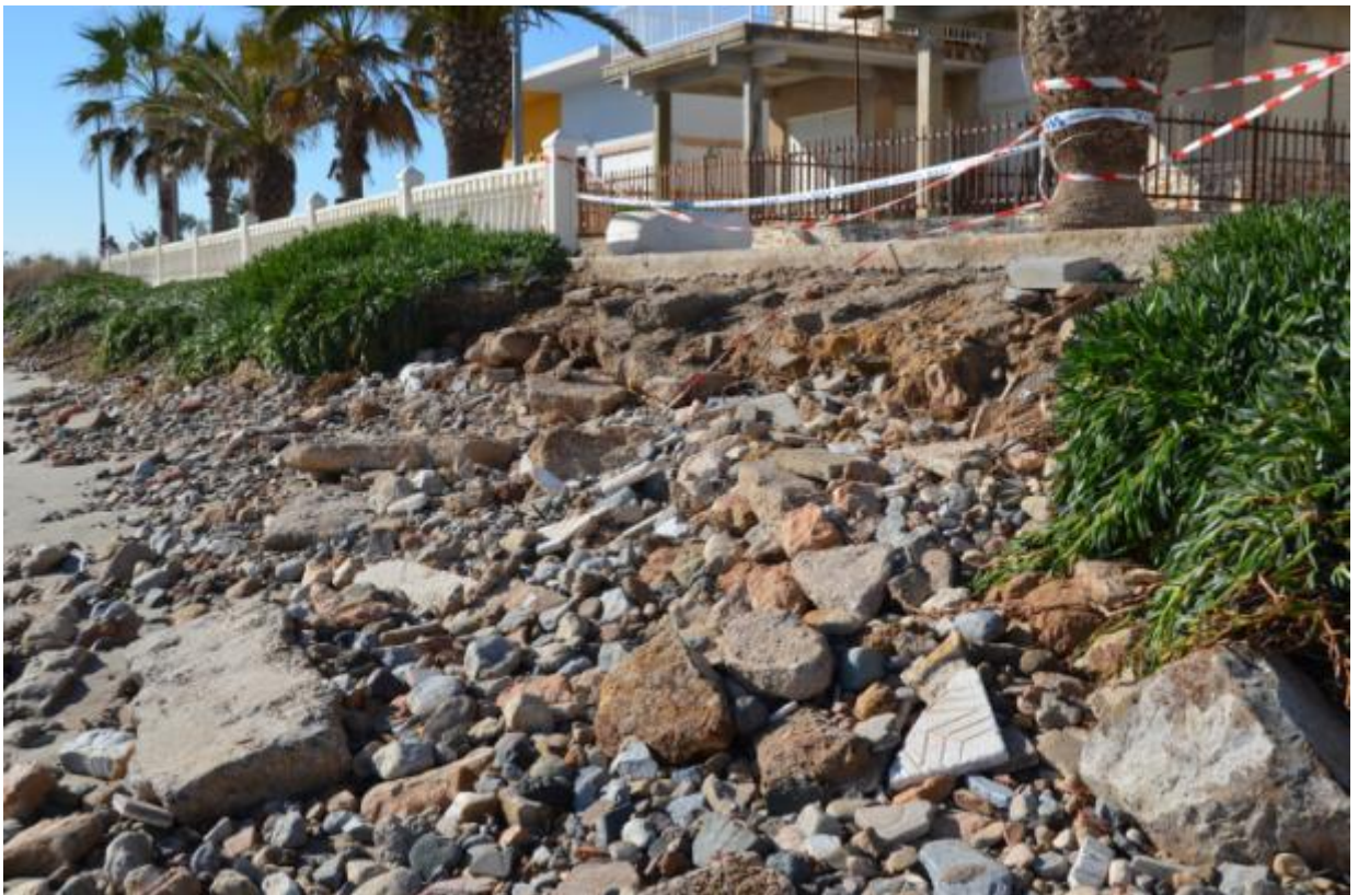
Pilar de la Horadada