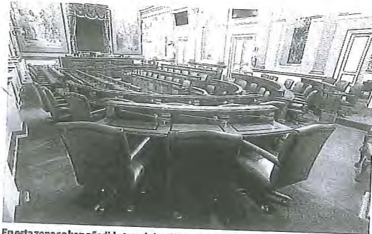
En esta zona se han añadido tres de los diez nuevos asientos para los diputados.

En esas zonas, y dificultando la apertura o cierre de los considerables portones, se han ubicado dos nuevos asientos a cada lado. Los otros seis escaños nuevos, con