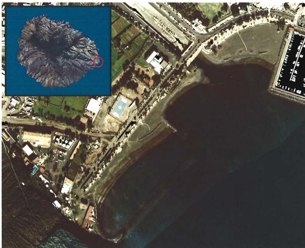
Figura 35. Playa de San Sebastián de La Gomera (Isla de La Gomera).