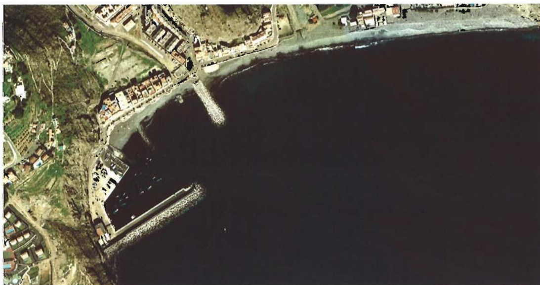
Figura 90. Año 2003