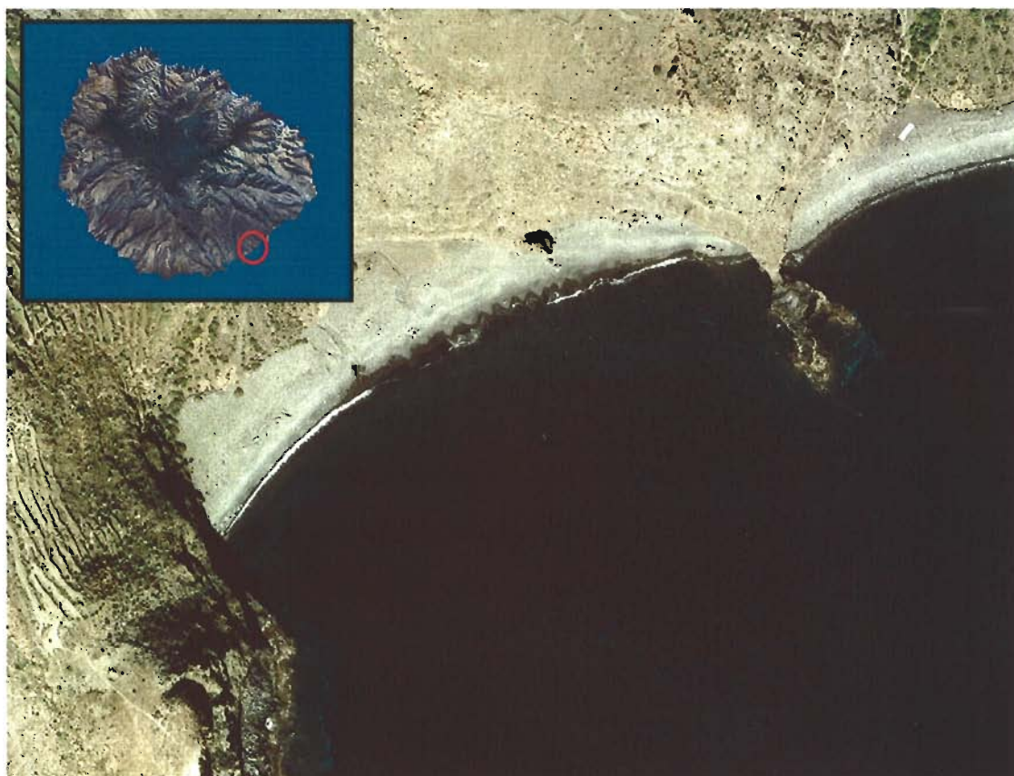
Figura 79. Playa del Medio (Isla de La Gomera).