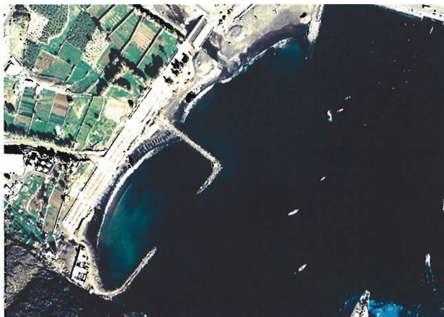
Figura 37. Año 1989