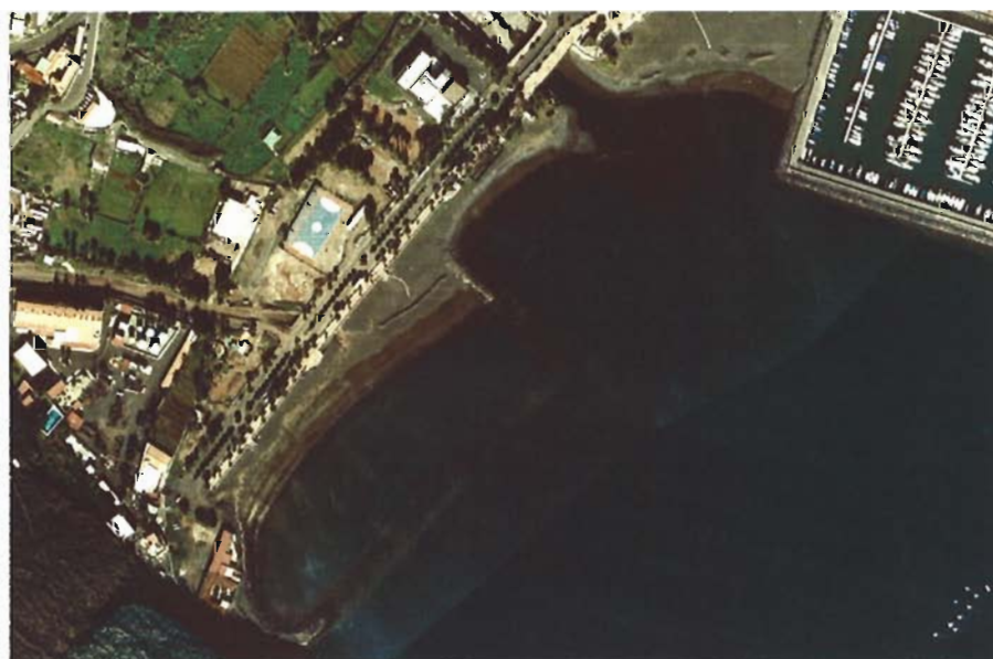
Figura 38. Año 2003