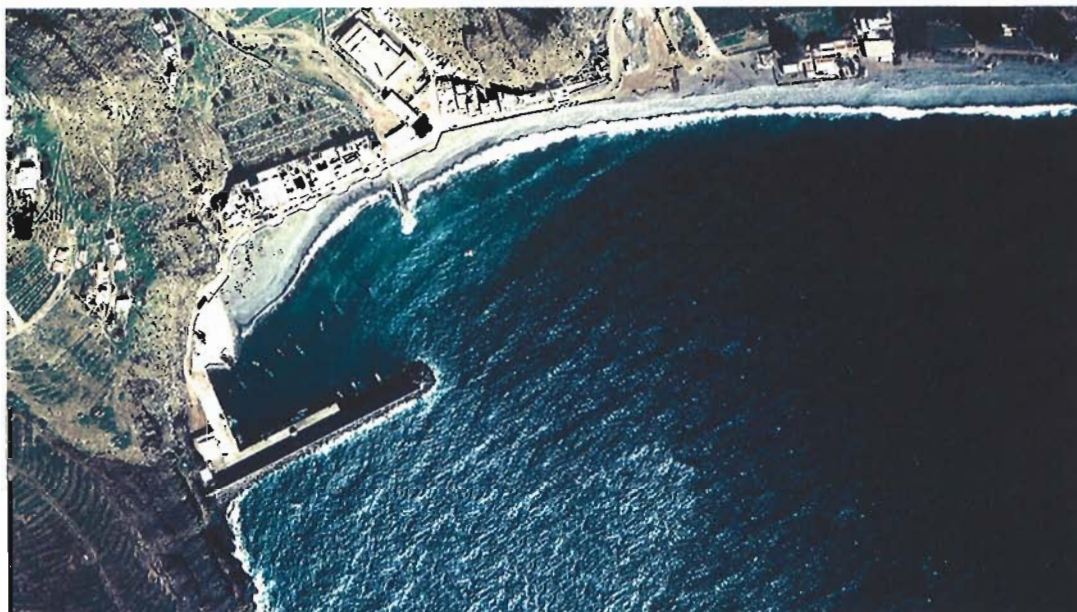
Figura 89. Año 1989