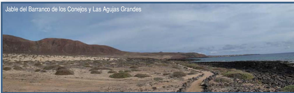
Jable del Barranco de los Conejos y Las Agujas Grandes

La ruta parte del extremo noreste de Caleta del Sebo y sigue de forma paralela a la costa, pasando frente a una vivienda solitaria que queda a la izquierda, frente a la cala de Los Ladrillos. A unos 200 m de la edificación el camino se bifurca, aunque la ruta sigue recto. Unos 300 metros más allá está la Caleta de Arriba, donde es frecuente encontrar mariscadores. Casi al final de esta caleta, el camino se incorpora a otro más ancho que viene de Caleta del Sebo por el interior. La ruta dibuja una amplia curva a la izquierda en el Jable de la Caletas, para continuar recto hasta la Caleta del Aguardiente, donde en las horas de marea baja puede verse un pozo artesiano de donde emerge el agua. En su extremo norte se abandona el camino más ancho para tomar la desviación que sale a la derecha y marchar junto a la línea de costa por la senda marcada por piedras. Al poco se pasa junto a los restos de la Calera de la Caleta del Aguardiente. El camino vuelve a virar hacia la izquierda para salvar la Baja del Ratón y tomar dirección norte hacia Pedro Barba hasta que se vuelve a encontrar con la pista que se abandonó en la Caleta del Aguardiente. En menos de 300 metros el camino se estrecha y vuelve a estar bordeado en piedra. Ahí se sitúa otra Calera, la del Barranco de los Conejos. Una pequeña cala al abrigo de Morro Negro se esconde al final de este barranco. A partir de aquí y durante unos 800 metros, el camino se hace más difícil, pues pasa por terrenos no muy