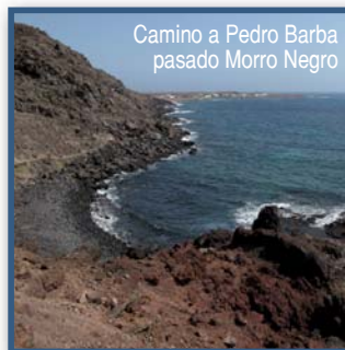
Camino a Pedro Barba pasado Morro Negro