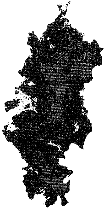
Lam. 2. División del área del Parque Natural de los Alcornocales en cuatro niveles del NDVI de IRS-1C WiFS. Entre paréntesis valor medio del área basimétrica de las parcelas del Segundo Inventario Forestal Nacional situadas en cada nivel de NDVI. Amarillo: NDVI \leq 0,25 (5,58 m 2 /ha), rojo: NDVI > 0,25 y \leq 0,35 (7,84 m 2 /ha), azul: NDVI > 0,35 y \leq 0,45 (11,43 m 2 /ha), verde: NDVI > 0,45 (14,54 m 2 /ha). [Division of the area of the Parque Natural de los Alcornocales according to four levels of the IRS-1C WiFS NDVI. Among brackets the mean basal area of the Second National Forest Inventory of Spain ground plots located in each level of NDVI. Yellow: NDVI \leq 0,25 (5,58 m 2 /ha), red: NDVI > 0,25 and \leq 0,35 (7,84 m 2 /ha), blue: NDVI > 0,35 and \leq 0,45 (11,43 m 2 /ha), green: NDVI > 0,45 (14,54 m 2 /ha).]