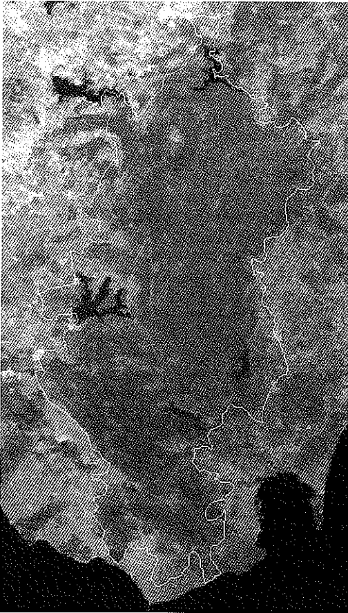
Lam. 1. Información IRS1-C WiFS georeferenciada del entorno del Parque Natural de los Alcornocales. Visible en rojo, infrarrojo cercano en verde. Límites del Parque en blanco. [Georeferenced IRS1-C WiFS information of the Parque Natural de los Alcornocales area. Visible in red, near infrared in green. Limits of the Park in white.]