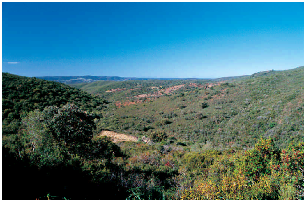
Matorral mediterráneo en la Sierra Morena de Sevilla.

inmediaciones del río Viar), los trabajos realizados a mediados de la década de los 90 no encontraron más que algunos indicios de presencia del lince. En la actualidad, la ausencia de datos de la especie se suma a los de la escasez de conejos en toda la zona, lo que hace pensar en que esta población ha desaparecido.