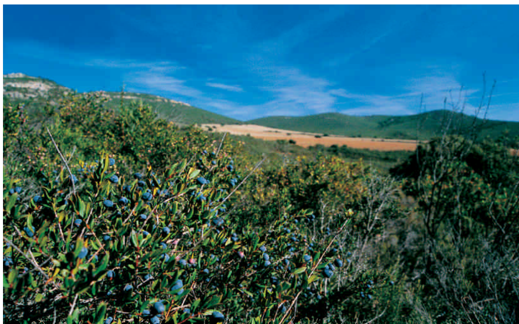
Sierras cubiertas de matorral mediterráneo en Badajoz.

Zarza-Capilla y la Dehesa de los Alta-rejos en Azuaya, se han encontrado pequeños enclaves con indicios de su presencia.