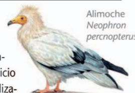
Alimoche Neophron percnopterus

El recorrido comienza al final de la calle principal de Villarreal, donde encontramos el panel de inicio de itinerario y la señalización que nos indica hacia la izquierda. Aquí tomamos el camino paralelo a la pared de piedra que asciende a la zona alta del pueblo y bajamos de nuevo hasta un pequeño arroyo que cruzaremos varias veces. De camino a la Fuente del Alisar encontraremos a la derecha un desvío hacia Villarreal que tomaremos a la vuelta. También podemos optar por tomar ese desvío y hacer solamente esta opción de ruta circular de 2,8 km (Villarreal-Serrano-Huerto del Ojaranzo-Villarreal). Desde El Alisar continuamos por una zona con restos de plantaciones de eucaliptos hasta la Fuente de los Tres Caños, un lugar muy acogedor para tomar un descanso.