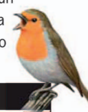
Petirrojo Erithacus rubecola

Podemos optar por este tramo del recorrido si no queremos subir a Cerro Gimio tras cruzar el Puente de Abajo. El recorrido por las pasarelas de madera junto al arroyo es muy agradable, y fresco en época de temperaturas más elevadas. Encontramos algunos ejemplares sobresalientes de fresno, madroñera y cornicabra. Hacia la mitad del tramo encontramos un puente de madera que conduce a una zona con merendero. Para continuar el itinerario hay que retroceder y cruzarlo de nuevo.