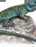
Lagarto ocelado Timon lepidus

Al cruzar el puente de madera comienza la subida por una cuesta de acusada pendiente perpendicular al arroyo hasta el collado, desde donde continuamos la senda ascendiendo pero de manera más suave. En la cumbre de Cerro Gimio hay restos de una atalaya romana del periodo republicano. Desde este mirador podemos observar el nido de un buitre negro en la espesura y disfrutar de las panorámicas de Peña Falcón, el río Tajo y los arroyos Barbaón y Malvecino. Es un buen lugar para contemplar el paisaje bravío de Monfragüe.