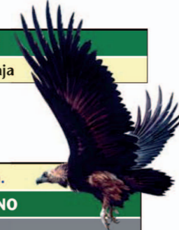
Buitre negro Aegypius monachus

Desde el Centro de Visitantes bajamos hacia la carretera y cruzando el paso de peatones, donde encontramos el panel de inicio de la ruta. El camino es ancho y transcurre al principio entre paredes de piedra, y después se convierte en una senda más estrecha que desciende por la margen de umbría del arroyo hasta el Puente de Abajo del Arroyo Malvecino.