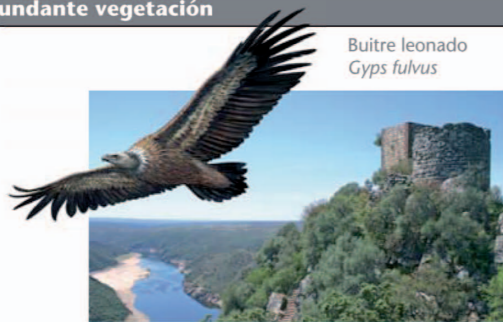
Buitre leonado Gyps fulvus

Tras disfrutar de una panorámica excepcional del Parque y las dehesas que lo rodean desde el excepcional enclave donde se ubican los restos de la fortificación de origen árabe, comenzamos el descenso por la ladera de umbría. El sendero está rodeado por una densa vegetación de madroñeras, durillos, quejigos, alcornos, etc.