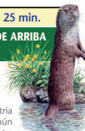
Nutria común Lutra lutra

Dejando el Puente de Piedra a la derecha continuamos un sendero que, paralelo al Arroyo Malvecino y sin ninguna dificultad, termina en la zona de descanso junto al Puente de Arriba.