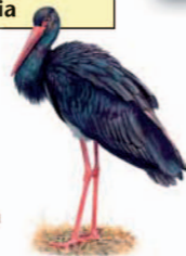
Cigüeña negra Ciconia nigra

La ruta incluye los valores más representativos del Parque: vegetación de umbría y solana, cortados rocosos, avifauna, patrimonio histórico y cultural, etc. Tiene la posibilidad de iniciarse en la zona de la Fuente del Francés (el aparcamiento está al cruzar el puente de la carretera a la derecha), sobre todo cuando el Puente del Cardenal está cubierto por el embalse, de manera que se convierte en un recorrido de 10 km y 3 horas y media de duración.