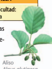
Aliso Alnus glutinosa

Ruta que transcurre por zonas diversas y agradables, como pequeñas huertas o algunos retazos de dehesa y matorral, además de fuentes cubiertas de fresnos y alisos. Al fondo discurre el río Tíetar, y llega hasta la denominada presa de los Saltos de Torrejón. La ruta es fácil sin fuertes pendientes.