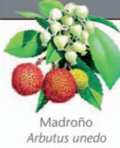
Madroño Arbutus unedo

El sendero comienza al final de la calle principal del pueblo, atraviesa la zona de Los Chozos (Aula de Naturaleza) y tras pasar una zona de huertos junto al pueblo desciende por la Vía Pecuaria hasta el Puente del Cardenal. Cuando este puente está cubierto por las aguas del embalse, la ruta se puede continuar ascendiendo al mirador junto a la carretera y siguiendo al lado de ésta hasta el Puente Nuevo. Tras cruzar el Puente del Cardenal, el sendero se separa de la vía pecuaria y pasa por delante de la Casa de Peones Camineros hasta llegar a la Fuente del Francés. De vuelta a Villarreal se repite el mismo recorrido desde la Casa de Peones Camineros, pero en ascenso.