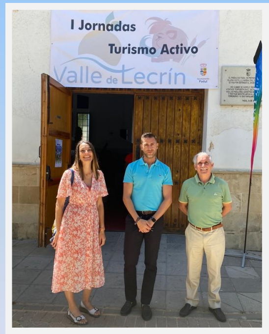
Personal del EN Sierra Nevada en las I Jornadas de Turismo Activo del Valle de Lecrín

para poder desarrollar el proyecto "Ecoturismo, una oportunidad de futuro en tu tierra".