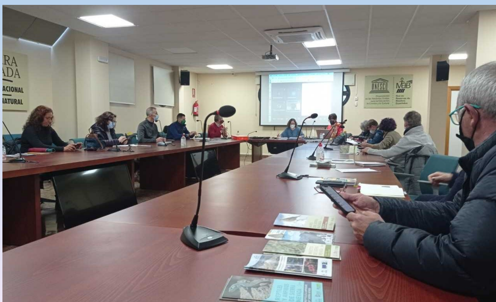
Participantes en el Foro Permanentes CETS Sierra Nevada

Se valora la organización del II Foro de Ecoturismo de Andalucía, con el objetivo principal de realizar un encuentro entre alcaldes/as