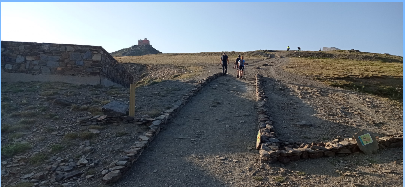
Acceso a la cumbre del Veleta

E l Pico Veleta es una de las cumbres más emblemáticas de Sierra Nevada y con el paso de los años son muchos los montañeros y turistas los que ascienden a su cima desde la Hoya de la Mora, lo que ha provocado la creación de sendas abiertas de forma espontánea con objetivo de reducir el trayecto y evitar la curvas de la carretera de acceso, caminos que erosionan y afean el paisaje.