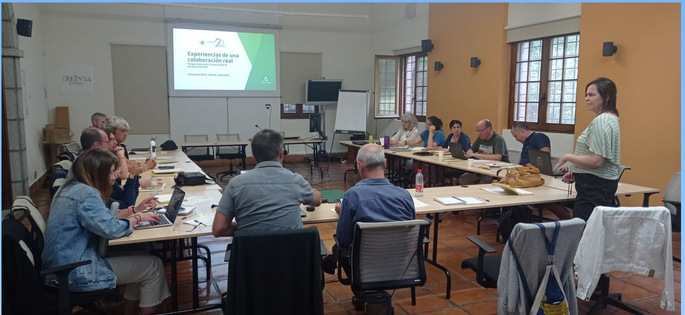
Participantes en el X Seminario de la CETS

D urante los días 8, 9 y 10 de junio, se celebró en CENEAM (Valsaín) el X Seminario Permanente de la CETS, con una participación de 20 técnicos procedentes de espacios protegidos españoles acreditados con la CETS.