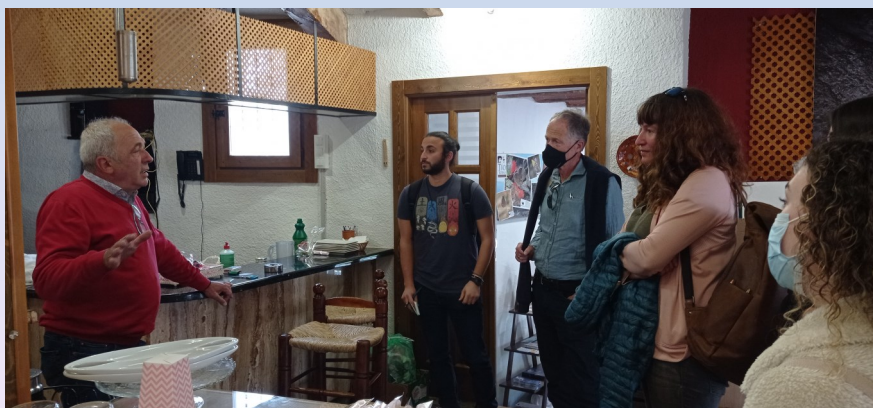
Momentos durante la visita a empresas de la CETS.