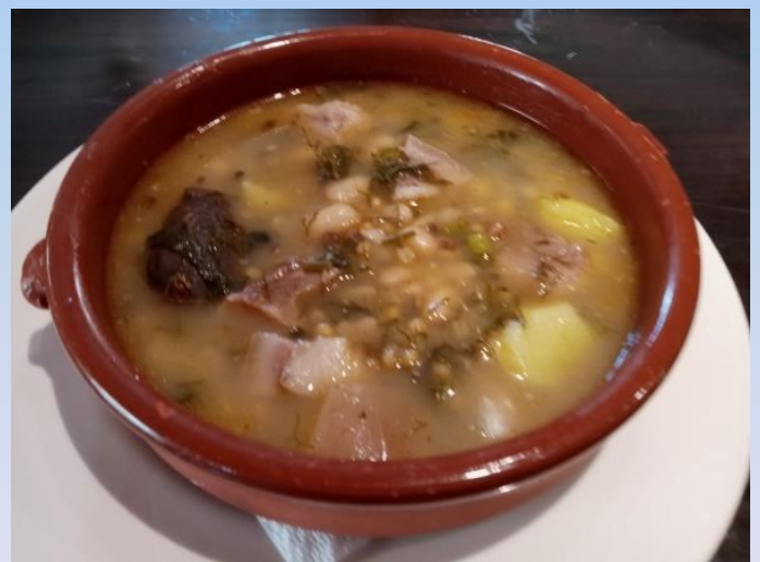
Potaje de hinojos

acompañan a legumbres y carnes; la ascendencia judía se refleja en la gran variedad de Potajes, como el famoso Potaje de hinojos , y la conservación de la succulenta repostería morisca, elaborada a base de almendra, miel y harina.