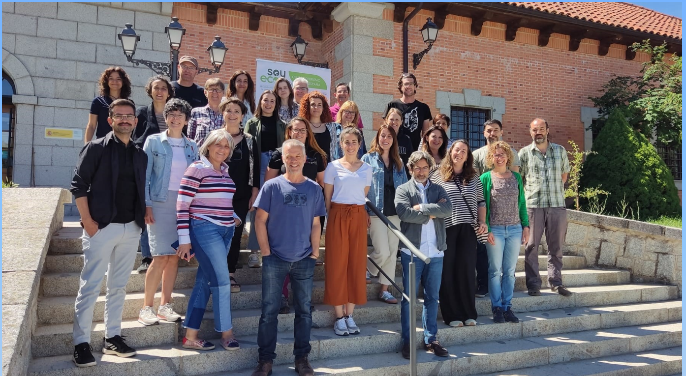
Participantes en el X Seminario del Club Ecoturismo en España

L a décima edición del Seminario permanente del Club Ecoturismo en España ha recuperado la asistencia presencial en el CENEAM, con una muy buena acogida tras dos años en los que se realizó online.