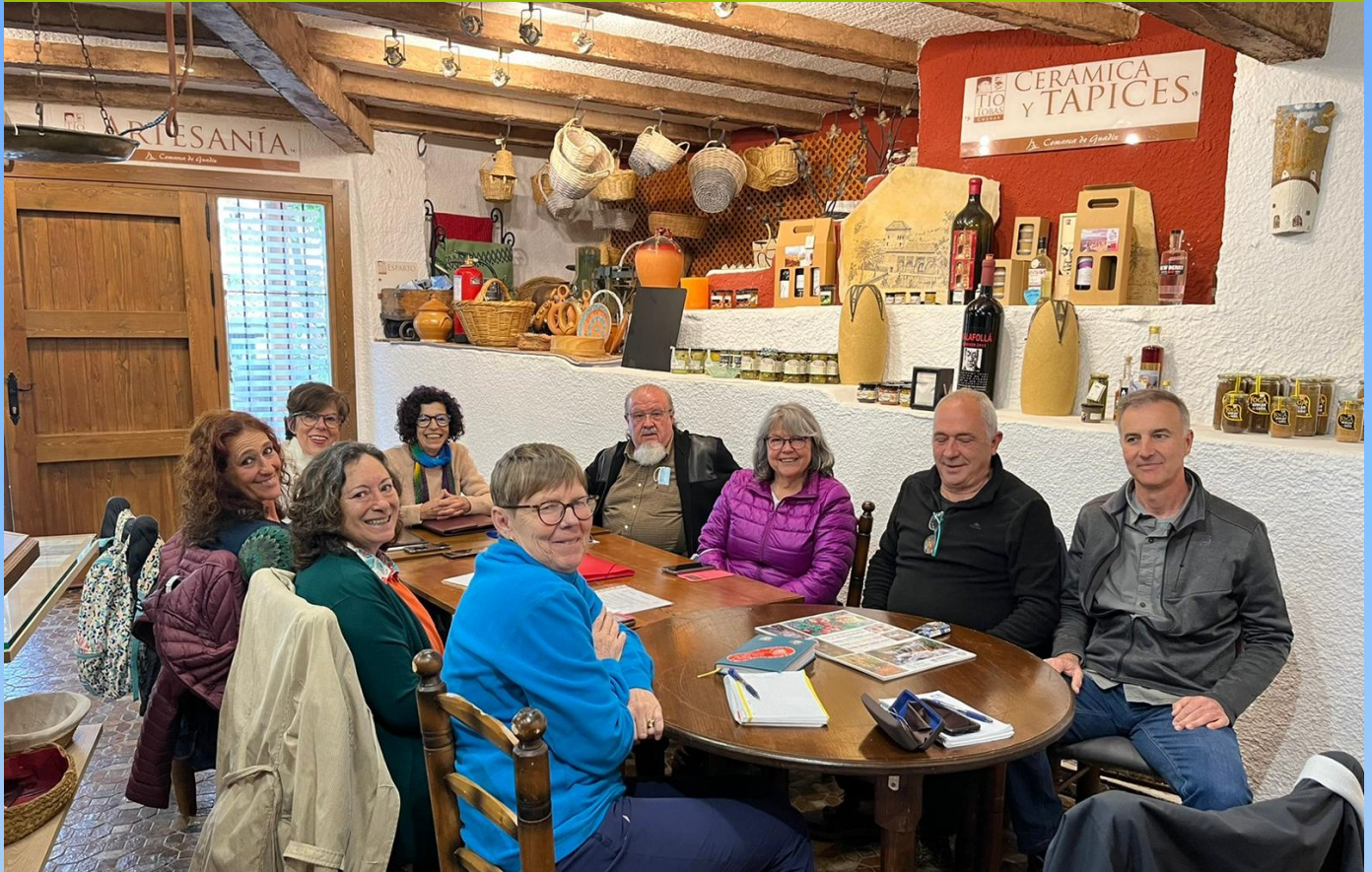
Empresarias y empresarios de la Asociación Foro CETS Sierra Nevada

Dada la carga de trabajo a la que se enfrenta la asociación del Foro y que aumenta paulatinamente, se propone la contratación de una secretaria con un número determinado de horas a la semana.