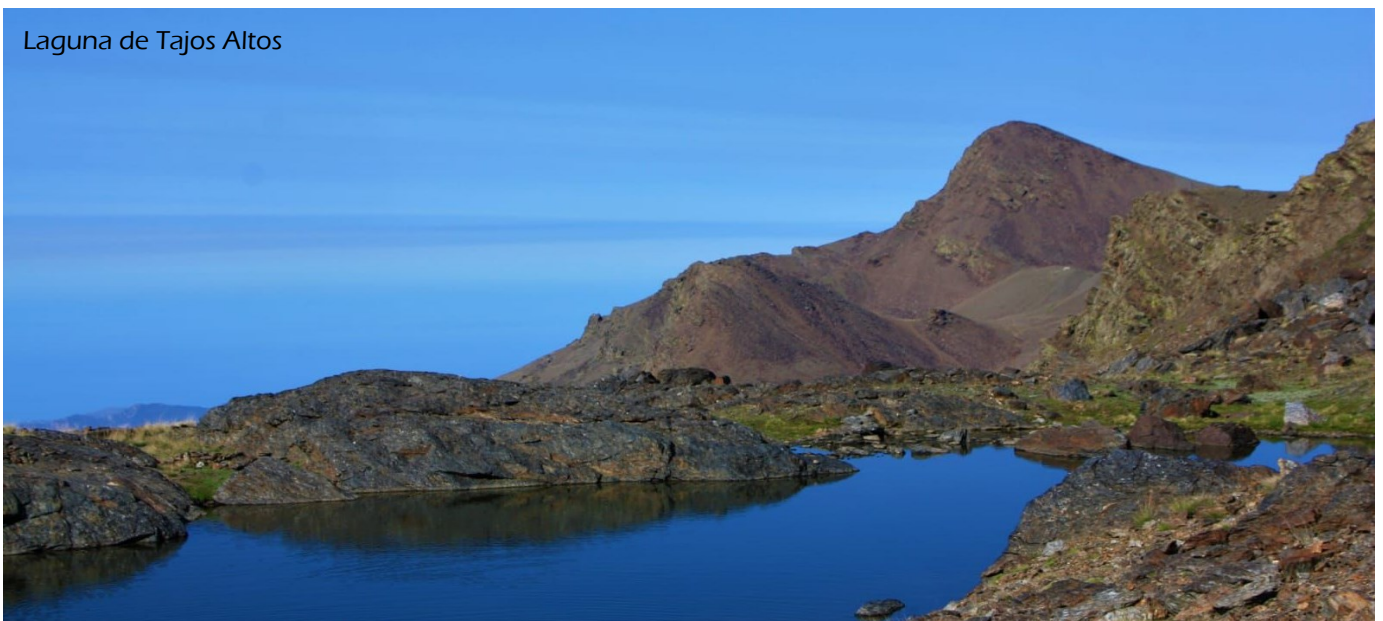
Laguna de Tajos Altos