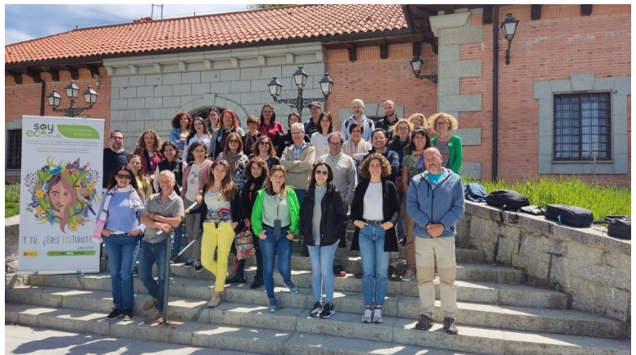
Participantes en el XI Seminario del Club de Ecoturismo en España

De l 24 al 26 de abril se celebró la XI edición del Seminario Permanente del Club de Ecoturismo en España donde participó la Asociación Foro CETS de Sierra Nevada y versó en la presentación del proyecto “Sostenibilidad y Digitalización de la red de Experiencias de Ecoturismo en España”, nueva plataforma web del Club Ecoturismo en España, tanto de comercialización como herramienta de gestión, trabajo en red y comunicación interna del Club.