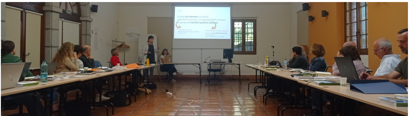
Participantes en el XI Seminario de la Carta Europea de Turismo Sostenible

Entre otros temas también se presentó la evolución del proyecto de la CETS durante el último año, tanto a nivel europeo como a nivel del Estado español.