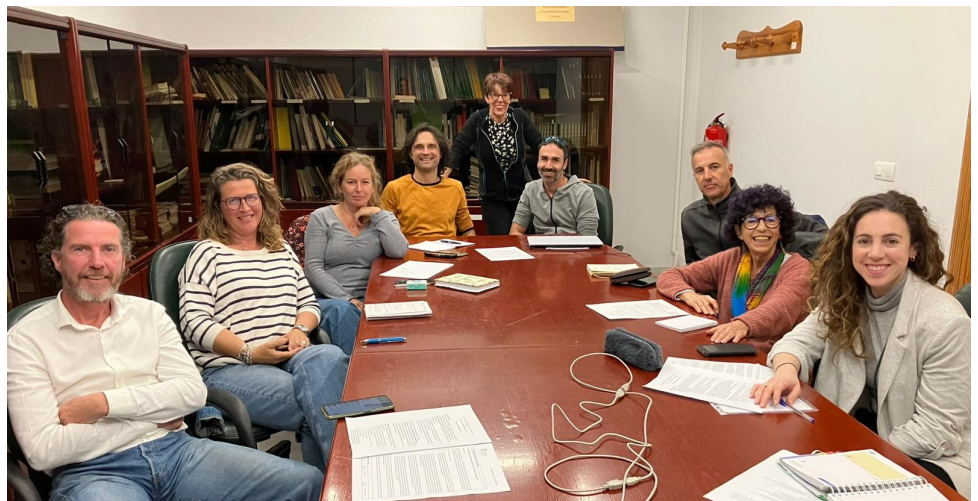
Empresas de la asoci. Foro CETS Sierra Nevada

Para su organización se ha creado un grupo de trabajo constituido por empresas de la CETS con la participación del Espacio Natural de Sierra Nevada.