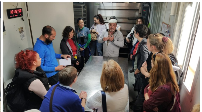
Diferentes momentos durante la celebración del curso “Guía de Ecoturismo de Sierra Nevada”

De sde el 22 al 31 de mayo se celebró el curso “Guía de Ecoturismo” con el objetivo de mejorar los conocimientos sobre el PN y PNAT Sierra Nevada, destinado a actores relacionados con el turismo que ofrecen su actividad en el territorio.