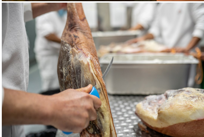
Imagen superior: Bodega Cortijo El Cura. Imagen inferior: Jamones Antonio Álvarez