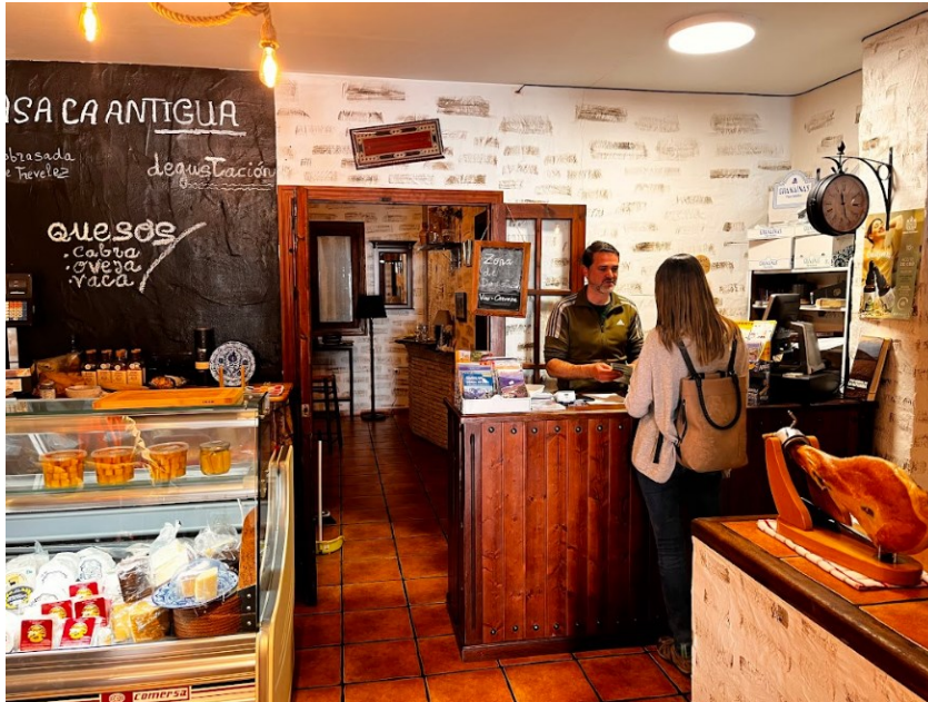
Entrevista a comerciantes locales

local y no está en manos de turoperadores extranjeros, si bien matizaron que su territorio está muy orientado al turismo y el resto de actividades tradicionales está perdiendo peso.