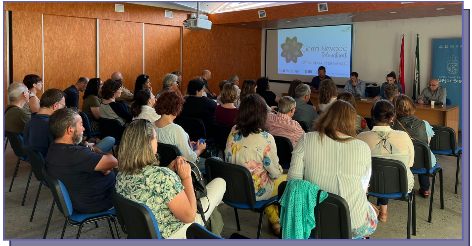
Presentación del proyecto de cooperación

Con el distintivo «Sierra Nevada. Todo Natural», todos los participantes pretenden dar a conocer las posibilidades turísticas y empresariales que ofrece el Parque Nacional y Parque Natural de Sierra Nevada más allá del turismo de nieve, que suponen un reclamo para los aficionados al ecoturismo por su riqueza ambiental y paisajística o al astroturismo, pero también para las empresas locales de estas zonas rurales.