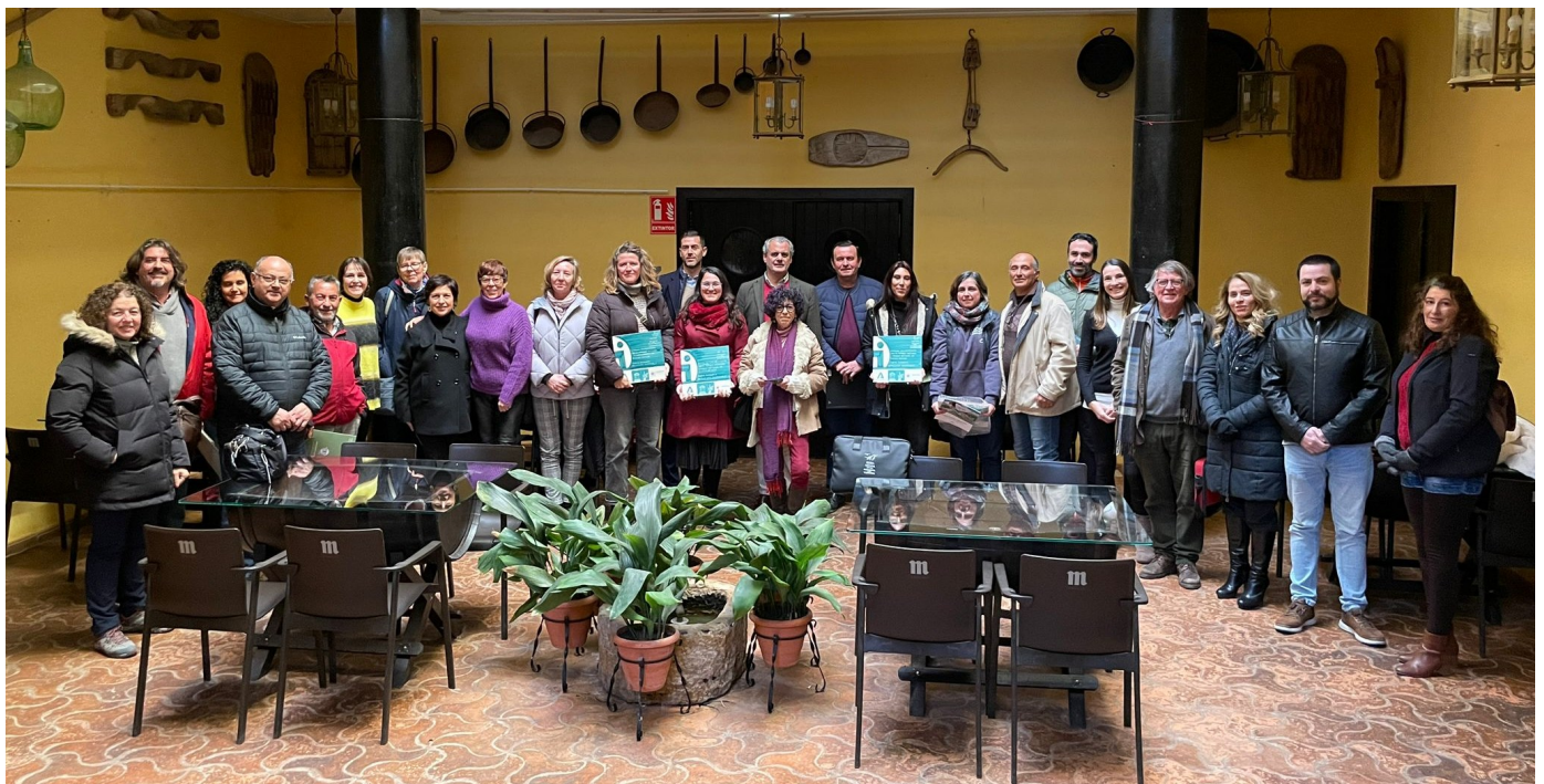
Participantes en el Foro CETS Sierra Nevada

Du rante éste primer semestre se ha reunido el foro permanente de la CETS en una ocasión, el día 26 de enero, en la Posá del Tío Pe-roles (Abla), donde participaron 25 personas procedentes de 18 entidades, públicas y privadas. Los principales temas tratados fueron: