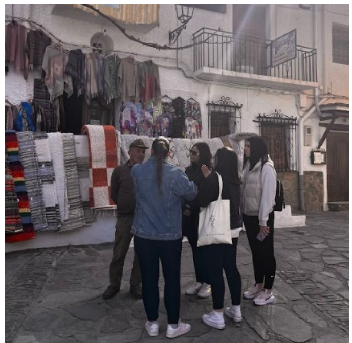
Estudiantes entrevistando a población local

vivencial y/o experiencial a través del conocimiento real del territorio montañoso de Sierra Nevada y de la inmersión en sus problemáticas. Para lo cual, asumieron un rol de aprendizaje activo en el que, por grupos de trabajo, llevaron a cabo entrevistas y encuestas a empresarios y comerciantes locales,