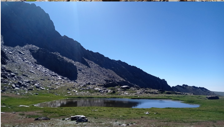
Imagen superior; personal de Sierra Nevada tomando datos. Imagen inferior: Laguna La Cabra.

Junto con los datos de frecuentación se anota el número de tiendas y número de cabezas de ganado, además de la existencia o no de corraletas, perros sueltos y otra información de interés, que permita obtener una relación entre la evolución de éstas lagunas en función de su uso, lo que permite extraer resultados útiles desde el punto de la mejora de la capacidad de gestión.