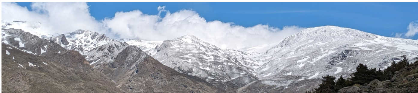
Cara sur 30-4-24