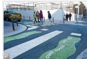
Un grupo de estudiantes recorren el camino que va a la escuela de La Prosperitat.