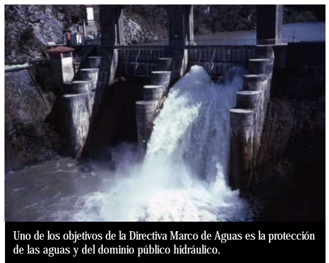
Uno de los objetivos de la Directiva Marco de Aguas es la protección de las aguas y del dominio público hidráulico.

Para finalizar esta reunión, se fijó el lugar y fecha de la siguiente, la cuarta reunión de este Grupo de Trabajo (Eslovenia, el 27 de junio), cuyos miembros convinieron en renombrar como Grupo de Trabajo de la Red Europea de Autoridades Ambientales "Política del Agua".