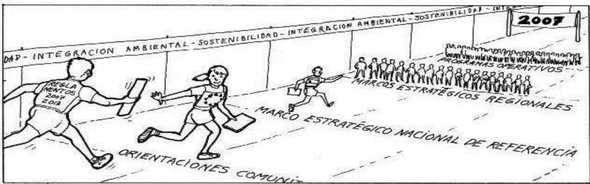
ILUSTRACIÓN: Juan Carlos Ambex

A la espera de las Orientaciones Estratégicas Comunitarias que elabora la Comisión para la programación 2007-2013, se acerca el momento de diseñar los diferentes Planes Estratégicos Nacionales. La plena disposición de apoyo por parte de las autoridades ambientales está garantizada.