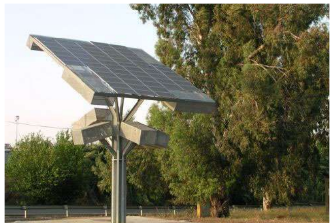
Instalación fotovoltaica en un barrio de Sevilla para iluminación viaria ("árbol solar"), visitada por miembros del Grupo de Trabajo de "Indicadores de Integración Ambiental y criterios ambientales de selección de Proyectos en la Programación de los Fondos comunitarios".

La reunión del Grupo de Trabajo fue complementada con una visita al denominado "Árbol solar" de energía fotovoltaica instalado en un barrio de la capital sevillana, dentro de un proyecto de implantación de energía renovable a nivel local llevado a cabo por el Ayuntamiento de Sevilla y la Agencia de la Energía de Andalucía.