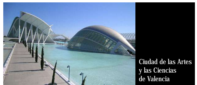
Ciudad de las Artes y las Ciencias de Valencia

Asimismo, la representante de la Unidad Administradora del Fondo Social Europeo expuso en la reunión un breve resumen de la propuesta de Reglamento del Fondo Social Europeo para el futuro período de programación 2007-2013.